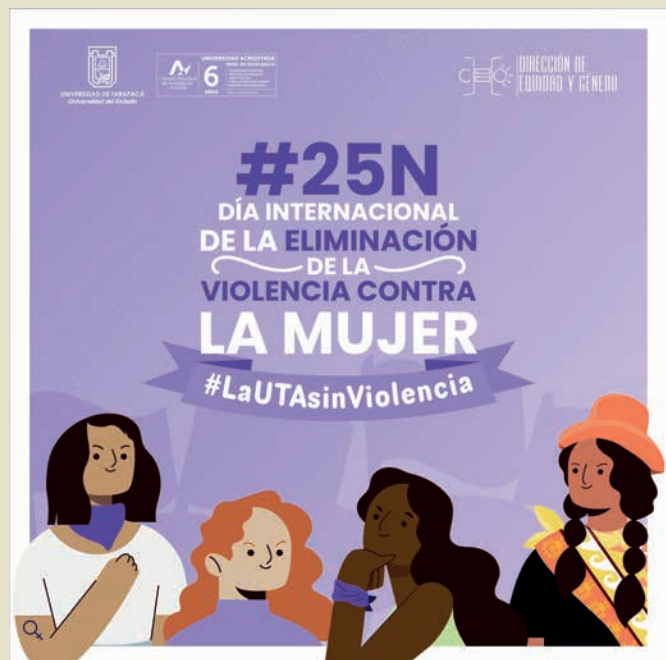
Propuesta 5 y elegida.