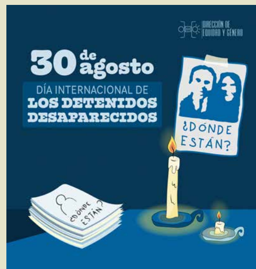
Propuesta 2 y elegida.