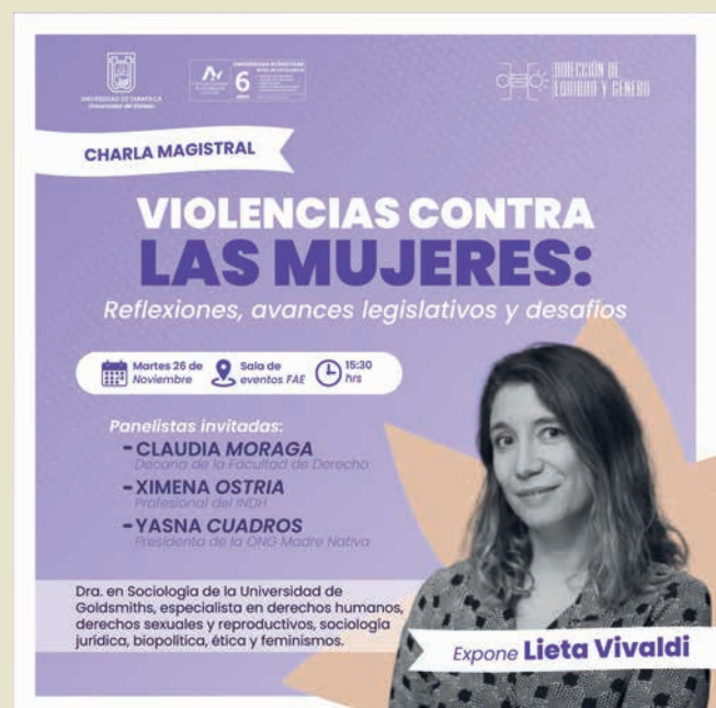
Propuesta 4 y elegida.