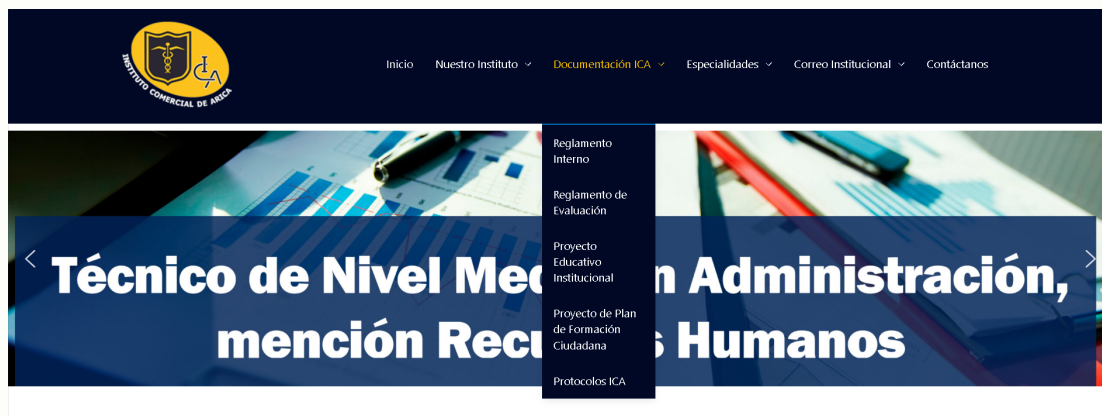
Figura 8: Página web Institucional / Sección Documentación.

El diseño fue creado con el objetivo de ser interactivo y fácil de usar para cualquier persona. Desde esta página, los usuarios podrán acceder y descargar todos los documentos de manera práctica y eficiente.