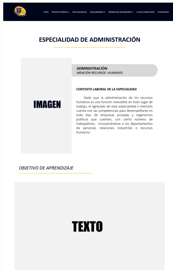
Figura 7: Pagina web Institucional / Sección Especialidades.

Este diseño (Figura7) se replicó en las cuatro especialidades: Administración, Contabilidad, Atención de Párvulos y Conectividad y Redes. Previamente, estas especialidades no contaban con una sección web propia, sino únicamente con un enlace a un archivo PDF que contenía toda la información.