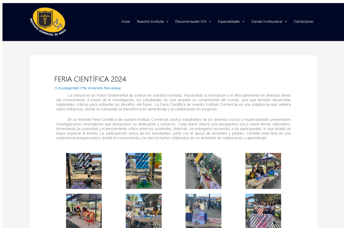
Figura 9: Pagina web Institucional / Sección Noticias.

Como propuesta, sugerimos reducir o reorganizar la galería de imágenes para optimizar su presentación y hacerla más funcional. A partir de esta idea, comenzamos a trabajar en una nueva base para la diagramación de esta sección, buscando un diseño que mantuviera un equilibrio visual, mejorara la experiencia del usuario y destacara tanto las noticias como los elementos gráficos de manera efectiva.