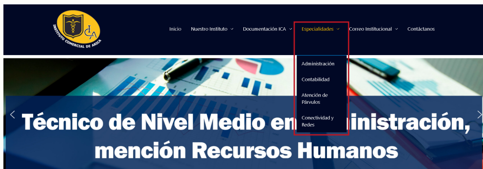
Figura 5: Pagina web Institucional / Sección Especialidades.

Al analizarla, lo único que preservamos es la información que sale en cada pdf, para tomar como referencia.