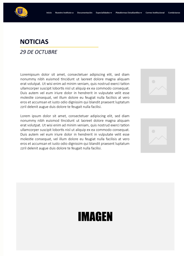
Figura 10: Página web Institucional / Sección Noticias.

El diseño final es más compacto y organizado, priorizando la claridad y la estética. Para destacar información clave, incluimos dos imágenes principales en la parte derecha, que sirven como contenido destacado o relevante. Este enfoque no solo hace que la sección sea más agradable a la vista, sino que también facilita el acceso a la información más importante de manera eficiente y atractiva.