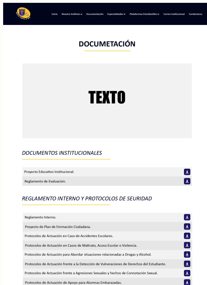
Figura 8: Página web Institucional / Sección Documentación.

Esta estructura no solo facilita la navegación, sino que también mejora la accesibilidad al permitir que los usuarios encuentren rápidamente la información que necesitan. Además, desde esta página es posible descargar los documentos directamente, lo que agiliza el acceso y garantiza que todos los materiales estén centralizados en un único lugar, contribuyendo a una experiencia más ordenada y funcional.