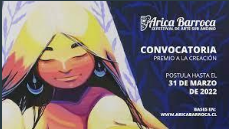
AFICHE ARICA BARROCA 2022, POR ANIS ANIS

En su novena edición, Arica Barroca busca fomentar la reactivación, la difusión, y la creación artística y cultural como eje de desarrollo integral, justo y sostenible. Las emprendedoras y emprendedores seleccionados podrán ser parte de la feria presencial ubicada en la Plaza Colón de Arica, los días del festival.