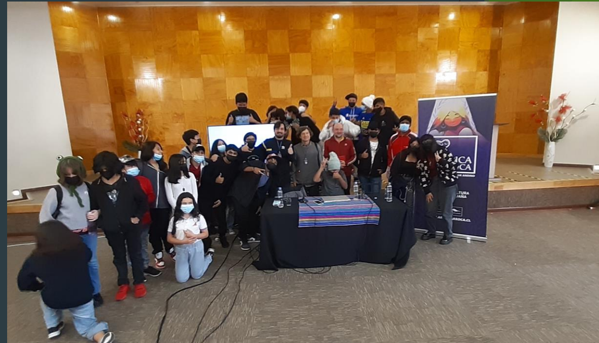
FOTO DEL LICEO CON LOS ENTREVISTADOS Y ALGUNOS ALUMNOS.