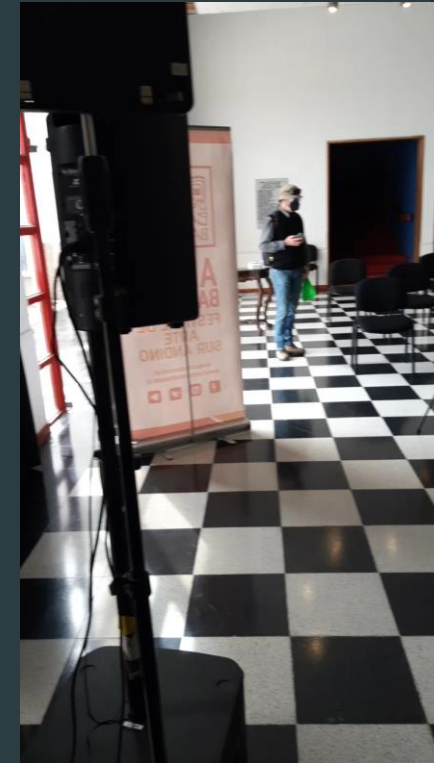
VIDEOS DEL PRIMER DÍA MONTANDO TODO EN EL TEATRO