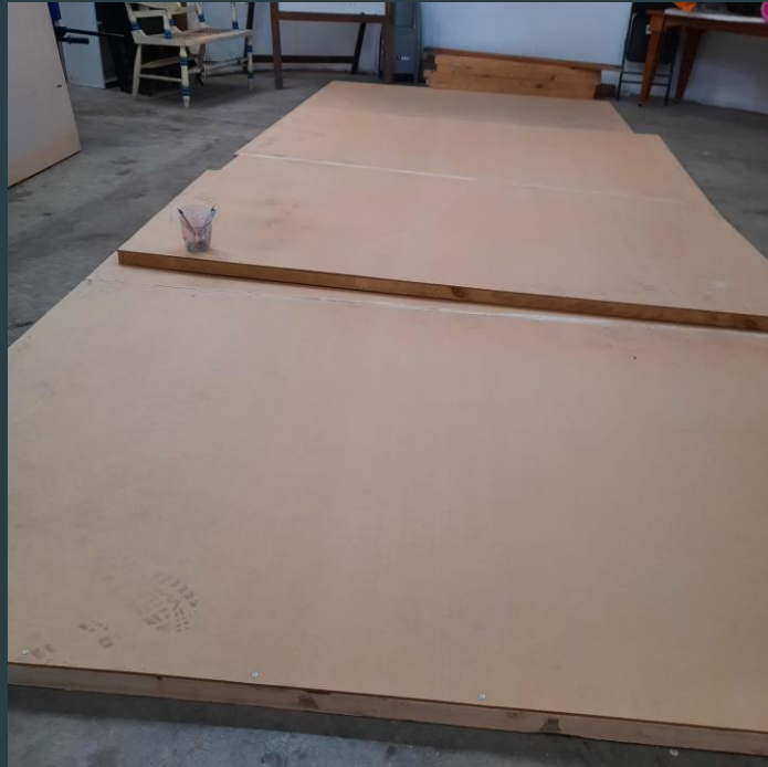
ASÍ SE VEÍA EL MURAL QUE PINTAMOS A INICIO