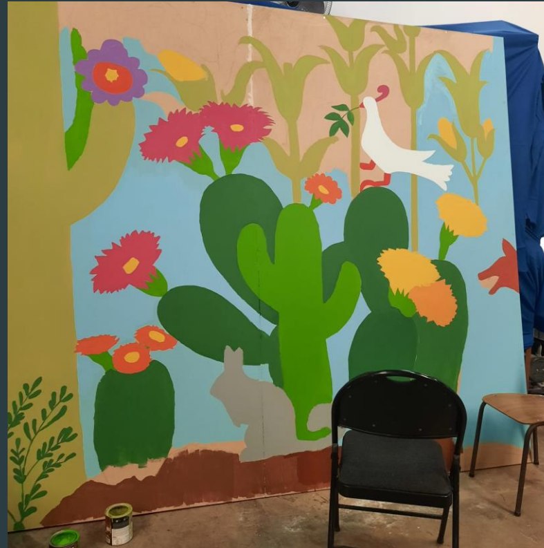
ESTE ES EL MURAL COMO LUCE AL FINAL