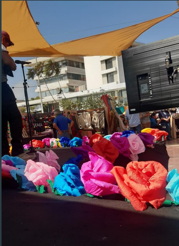
FOTO DEL FESTIVAL DETRÁS DEL ESCENARIO.