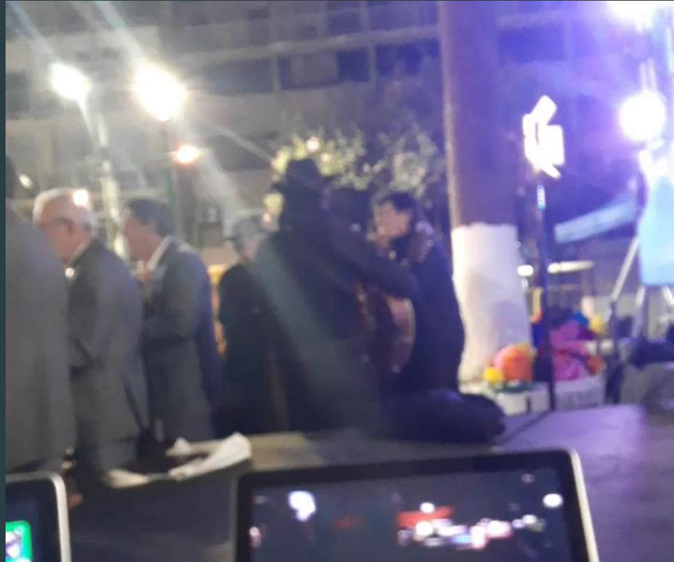
LA BANDA QUE APARECIÓ EN EL FESTIVAL