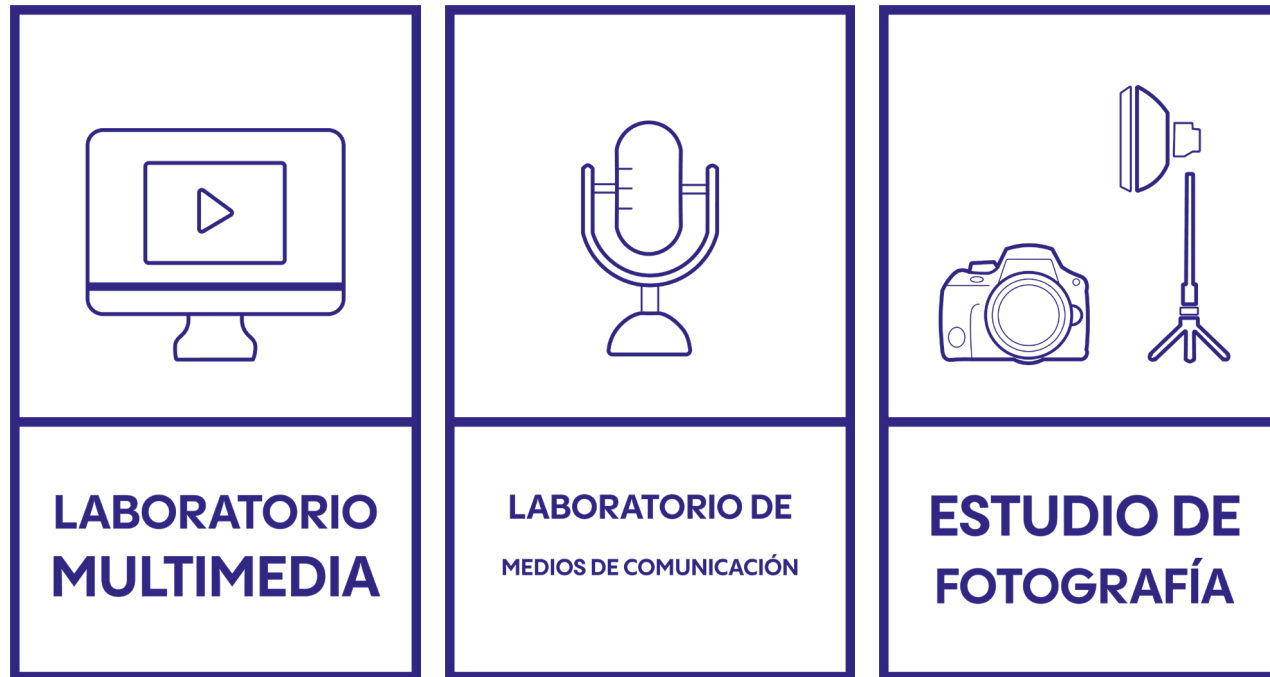
Carteles de identificación de salas para la carrera de Diseño Multimedia.