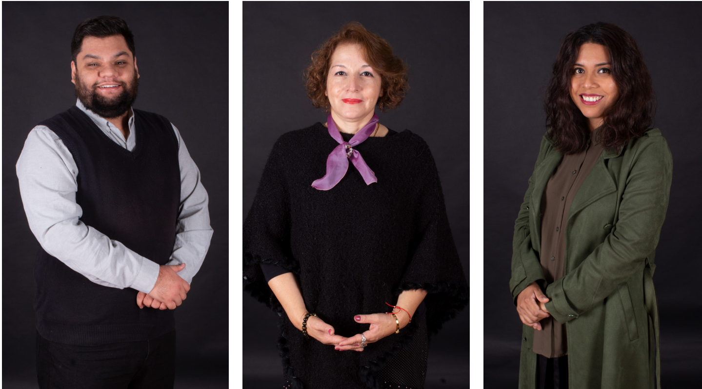
Fotografía a profesores de INGECO en tres posiciones: frontal, tres cuartos izquierda y tres cuartos derecha.