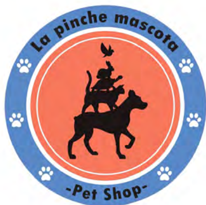
Diseño de logos (Isologo, Isotipo y imagotipo)