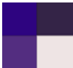
Prueba de color inicial.

Se usaron diferentes matices de este color: