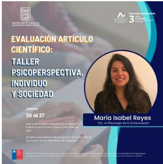
FIGURA 10. Afiche taller "Psicoperspectiva, individuo y sociedad".

Varias de estas publicaciones tuvieron una retroalimentación previa y sugerencias para un mejor resultado, por lo que tomó tiempo en diagramar una composición de acuerdo al mensaje que se quería entregar.