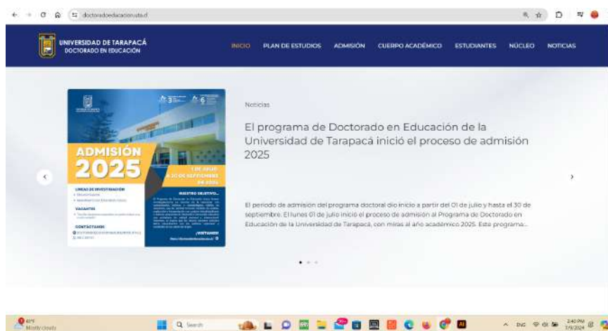
FIGURA 9. Afiche admisión 2025 publicado en la página oficial del Programa Doctorado en Educación.