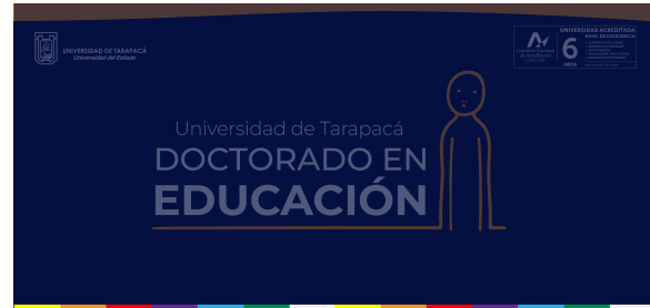
FIGURA 4. Propuesta banner newsletter con poca opacidad.