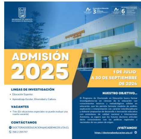
FIGURA 8. Afiche admisión 2025.

El programa Doctorado en Educación está en constante publicación con las redes sociales, brindando diferentes novedades en relación con el programa, ya sea charlas magistrales, talleres de doctorales en educación superior, próximas convocatorias, entre otros. Por lo que me solicitaron mostrar diferentes propuestas con respecto a cada tema en particular, sin cambiar la identidad del programa (manteniendo una paleta de colores acorde, un estilo formal y sutil y no sobrecargado) en las mayorías de las figuras podemos apreciar una misma paleta de colores (azul, naranja, amarillo) en la cual son los colores representativos de la Universidad de Tarapacá, por lo que el Doctorado en Educación ha querido mantener esa identidad en sus publicaciones.