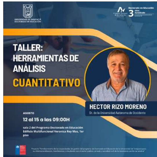
FIGURA 11. Afiche taller "Herramientas de análisis cuantitativo".