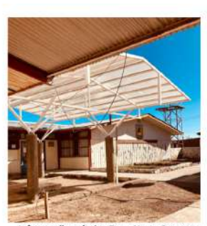
FIGURA 13. Portada original “Proyecto Anillo ATE 230053”.

En este caso se me pidió rediseñar un informe del Proyecto Anillo en la cual el Doctorado en Educación sería partícipe, con el fin de que este sea una nueva propuesta más llamativa y agradable al momento de leerlo. Este informe consta de 43 páginas, de modo que tuve que crear un diseño para cada una de estas. En las siguientes figuras se pueden apreciar las primeras páginas del documento original.