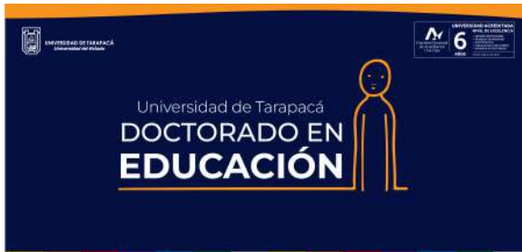
FIGURA 3. Propuesta banner newsletter a color.

En las siguientes figuras podemos apreciar una variedad de Banners, desde propuestas de colores a propuestas en blanco y negro. Finalmente quedaron satisfechos con la propuesta de la figura 3, en la cual la emplearon para la portada del Newsletter, en donde lo podemos ver en la figura 7.