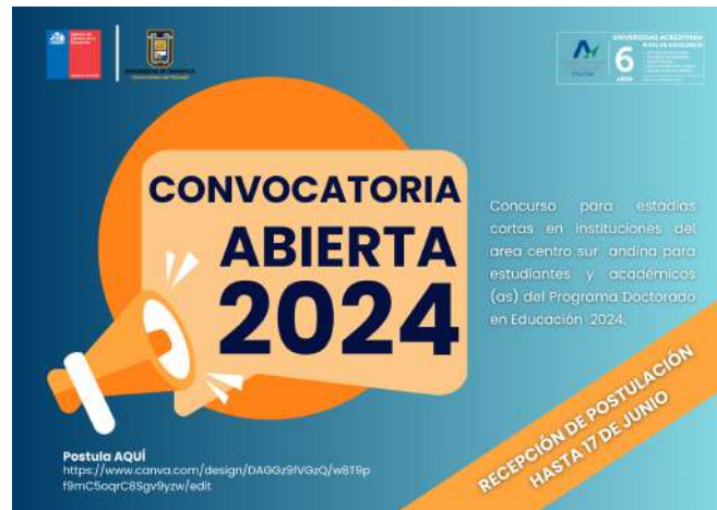
FIGURA 12. Afiche taller "Convocatoria abierta 2024".