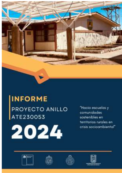
FIGURA 17. Propuesta de portada "Proyecto Anillo ATE 230053".

Siguiendo con la misma estructura de los diseños anteriores, utilicé la misma paleta de colores (azul, naranja y amarillo) manteniendo un formato formal pero amigable para quien lo lea, quedando así satisfechos con el resultado.