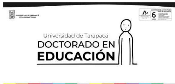
FIGURA 6. Propuesta banner newsletter negativo.