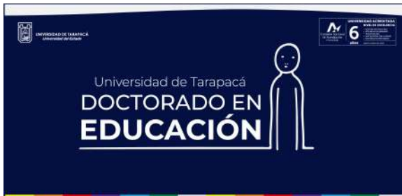
FIGURA 5. Propuesta banner newsletter positivo.