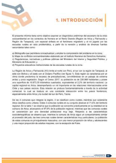
FIGURA 19. Propuesta de introducción "Proyecto Anillo ATE 230053".