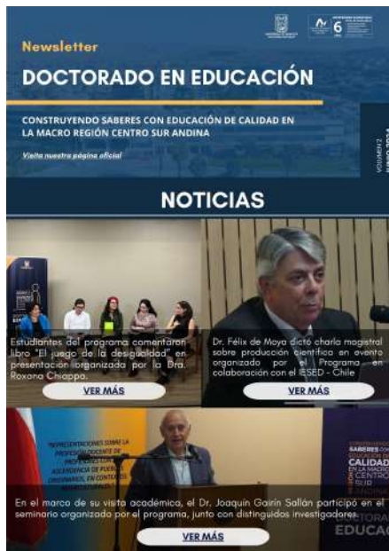
FIGURA 1. Newsletter Doctorado en Educación

A continuación, para tener una idea mas clara, se puede ver el formato que emplea el equipo para crear los Newsletter, diseñados por ellos mismos.