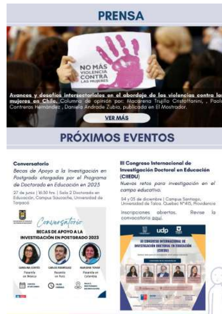
FIGURA 2. Newsletter Doctorado en Educación