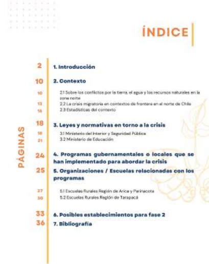
FIGURA 18. Propuesta de índice "Proyecto Anillo ATE 230053".