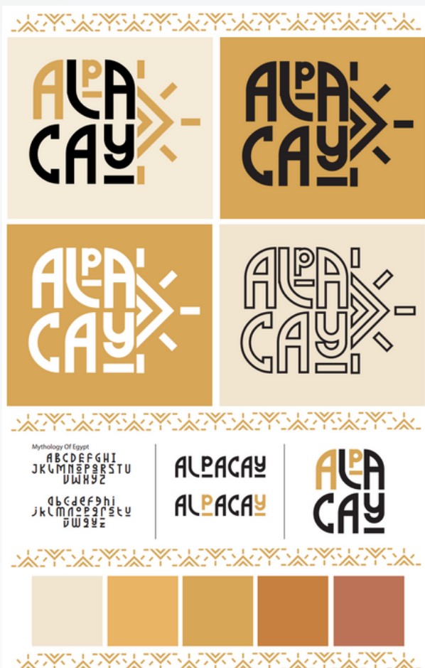
Imagotipo y variaciones

El diseño fue bocetado en papel y luego creado directamente en Adobe Illustrator, realizándose de inmediato el vectorizado y su presentación para ser mostrado en la siguiente reunión, siendo así, aceptado.