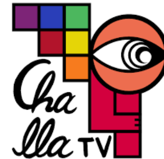
Nota. 2do Logotipo de Challa TV [Imagen], por Challa TV, Facebook, web.facebook.com/photo/?fbid=488858053245669&set=a.488858043245670