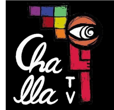
Nota. 1er Logotipo de Challa TV [Imagen], por Challa TV, Youtube. youtube.com/@challatvarica