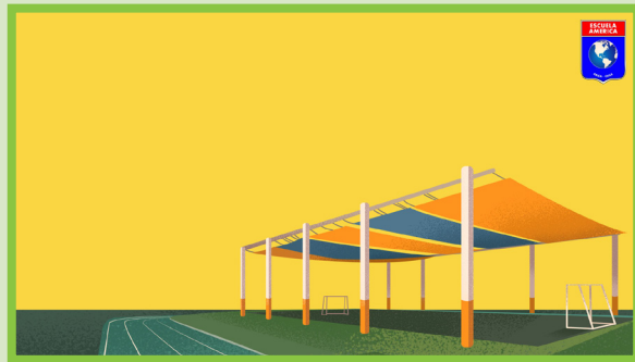
Figura 2. Página de la plantilla. El dibujo es de la cancha del establecimiento.