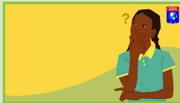
Figura 3. Página de la plantilla. El dibujo es de una niña utilizando el uniforme de la escuela.