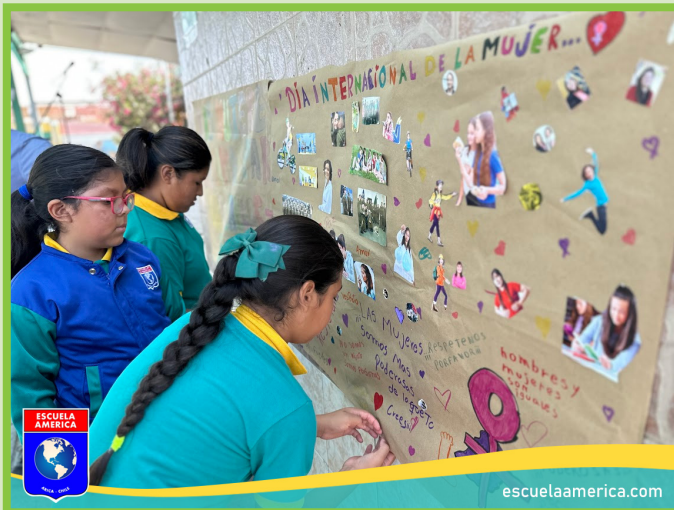
Figura 5. Marco de imágenes horizontal.

Se le implementa el marco a las fotos disponibles en la página web de la escuela.