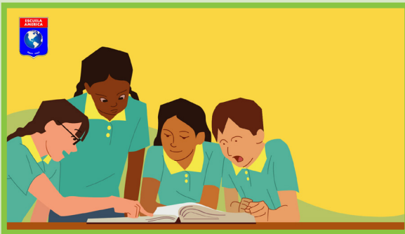
Figura 1. Portada de la plantilla. Niños vistiendo el uniforme de la escuela leen un libro.

Se crean los dibujos para la plantilla que será ocupada por docentes.