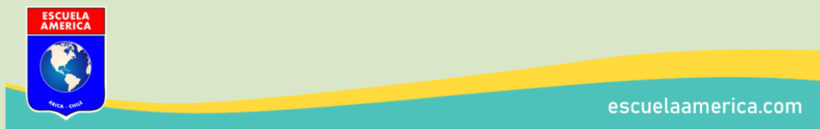
Figura 5. Marco de imágenes.

Se crean distintas versiones de los marcos de foto, incluyendo horizontal y vertical.