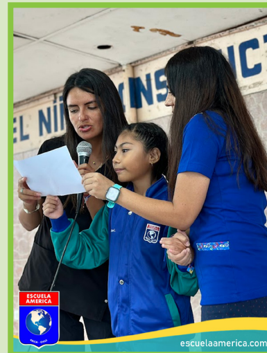
Figura 5. Marco de imágenes vertical.