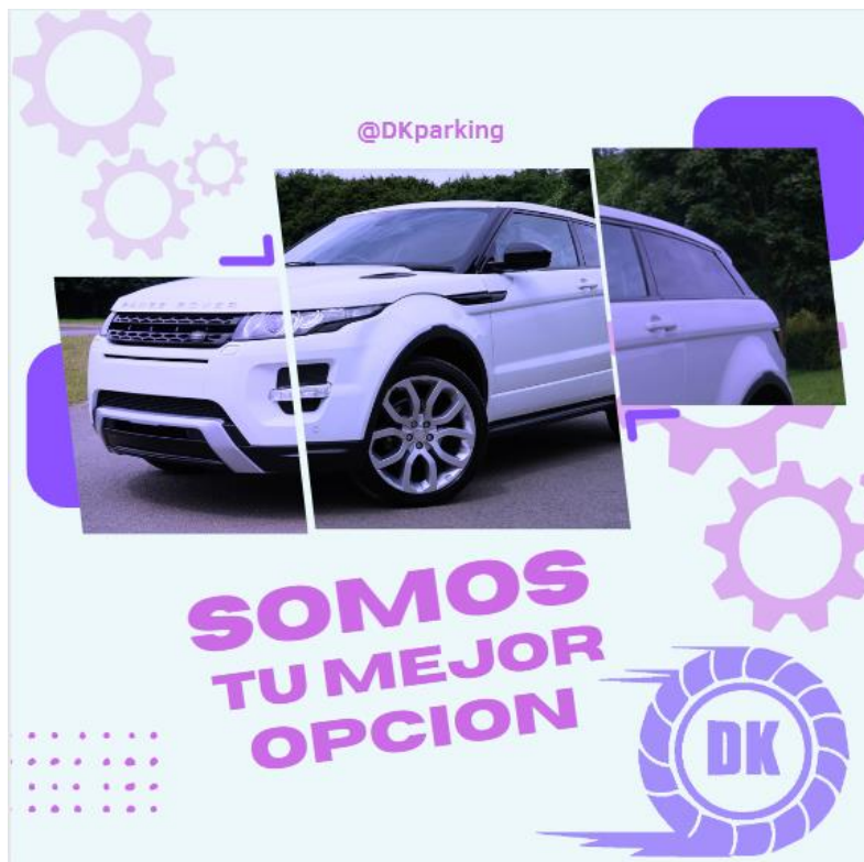
Figura 03 lavado de autos