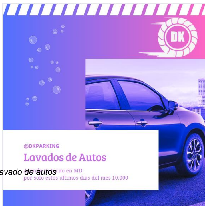
Figura 04 lavado de autos como en MD por solo estos ultimos dias del mes 10.000