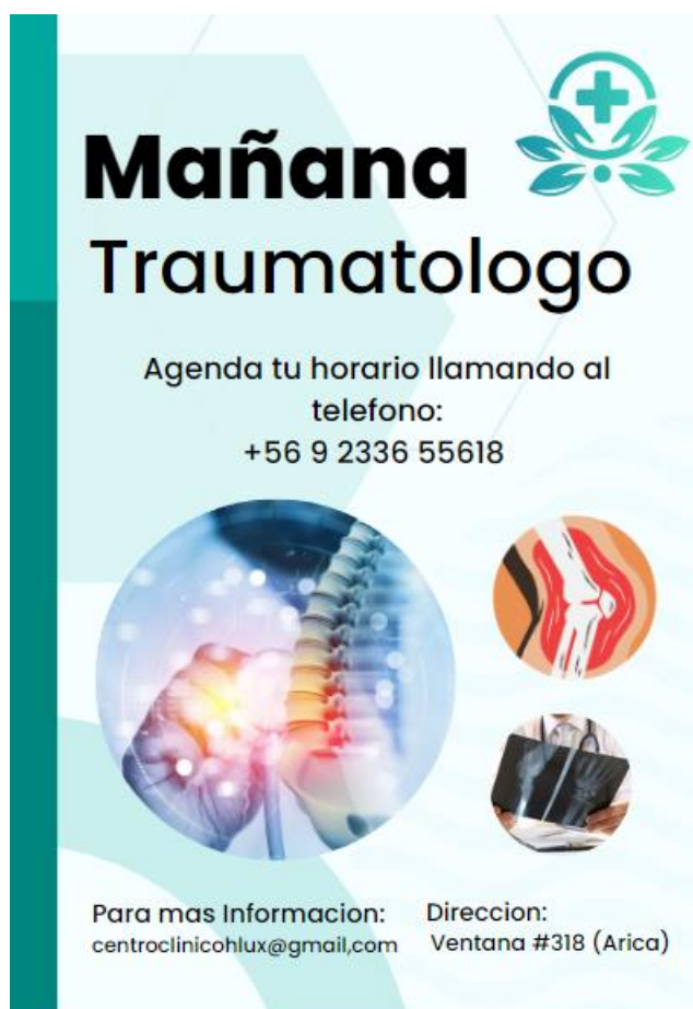
Figura 07 afiche traumatólogo

Aparte de la propaganda digital me pidieron crear un afiche donde menciona que tal día había horas del especialista (traumatólogo)