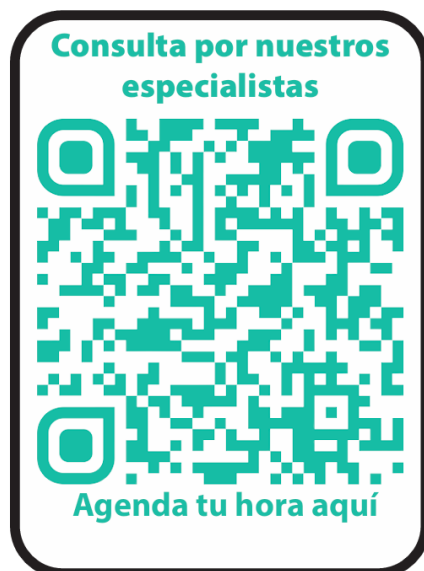
Figura 08 Código QR

Realice un Código para las tarjetas de presentación a causa de que el empleador no coloco la información en la tarjeta