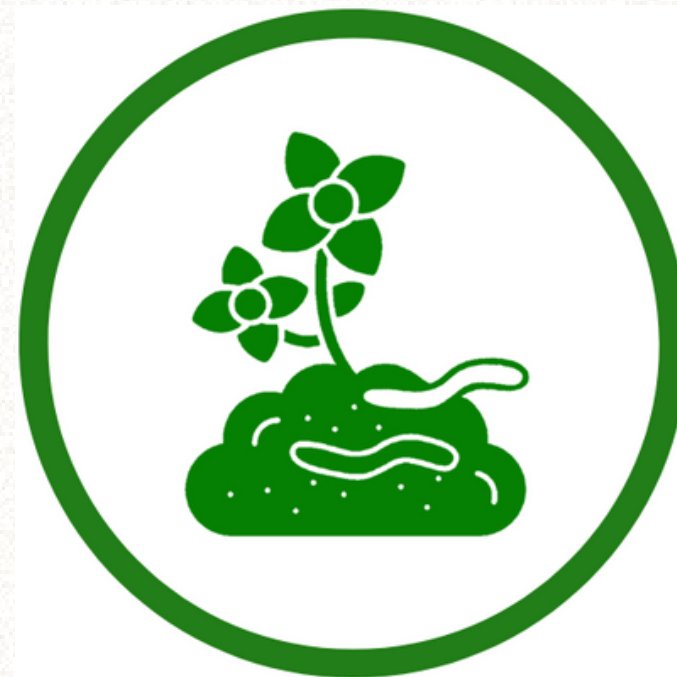
ÍCONO PARA HISTORIA DESTACADA