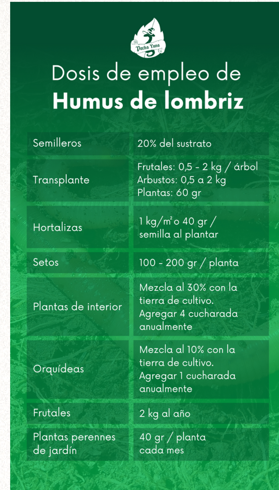
INFORMACIÓN PARA HISTORIA DESTACADA