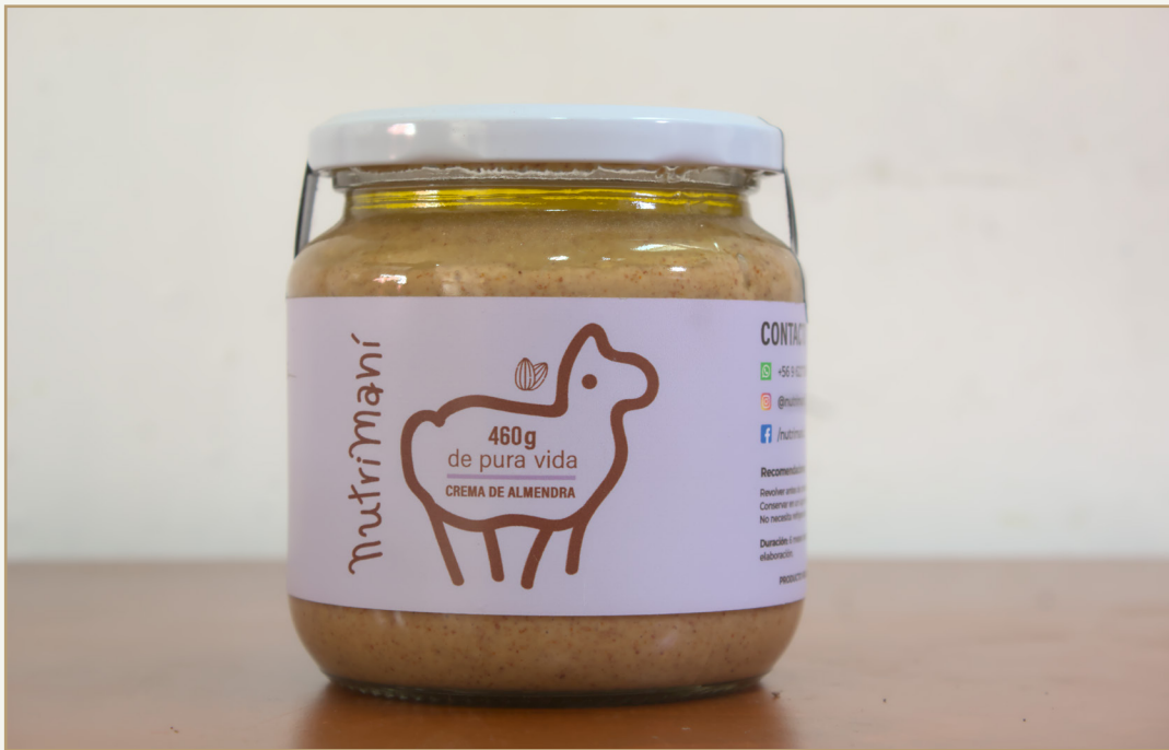
Fig.16 Fotografía que se tomo para el catalogo