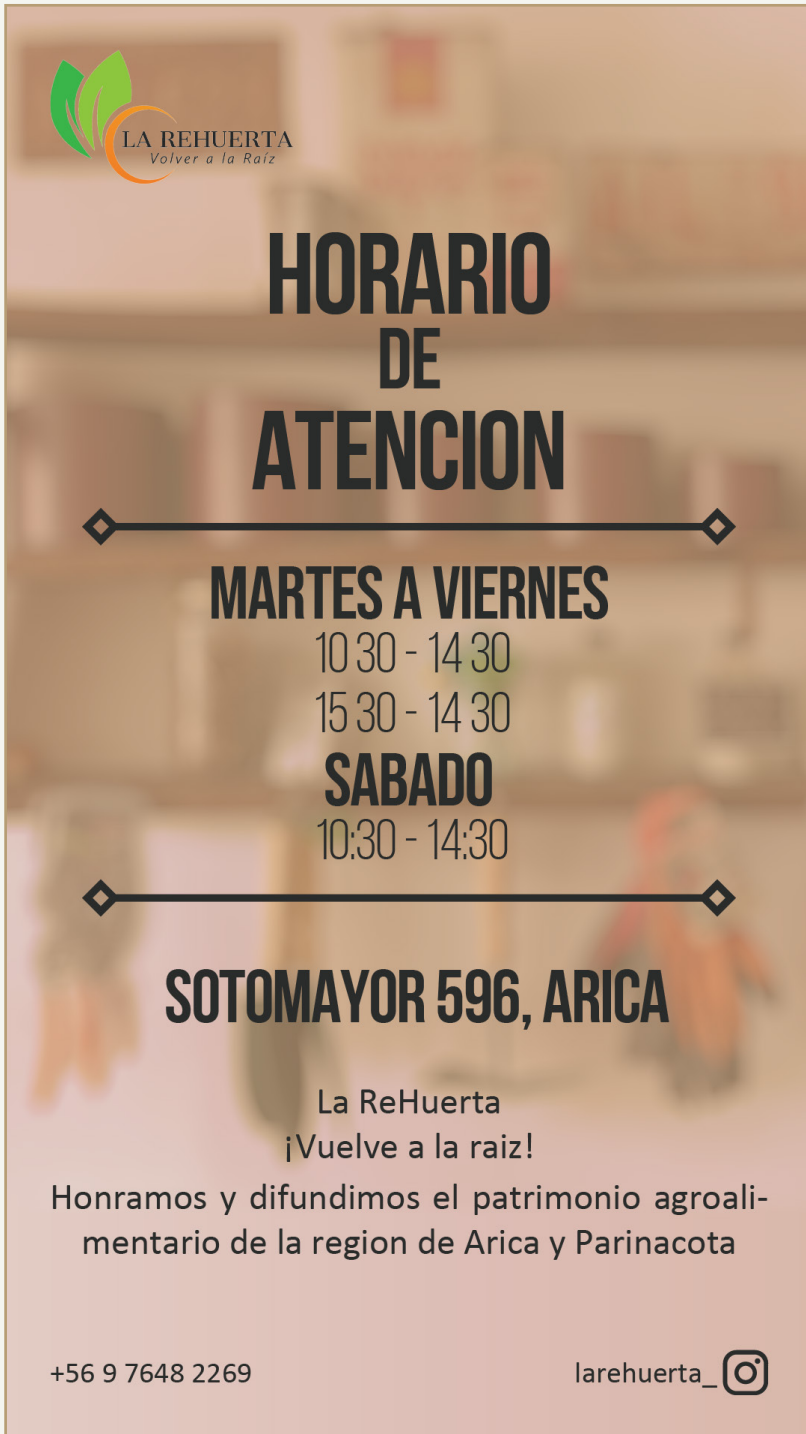
Fig.1 Afiche con la informacion de la empresa, en formato A4