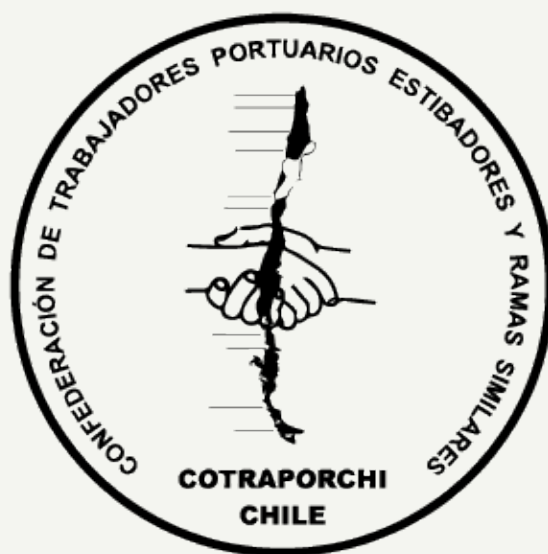
Fig.4 Etiqueta para el producto del evento lado A.