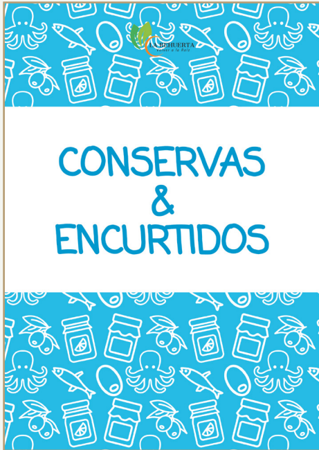
Fig.10 Segunda version del catalogo