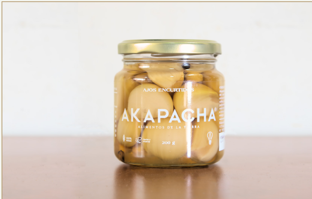
Fig.17 Fotografía que se tomo para el catalogo