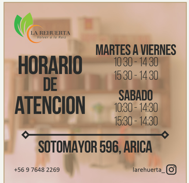
Fig.3 Afiche con la informacion de la empresa, en formato 1:1