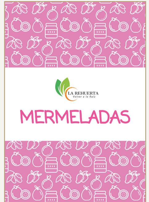
Fig.12 Segunda version del catalogo