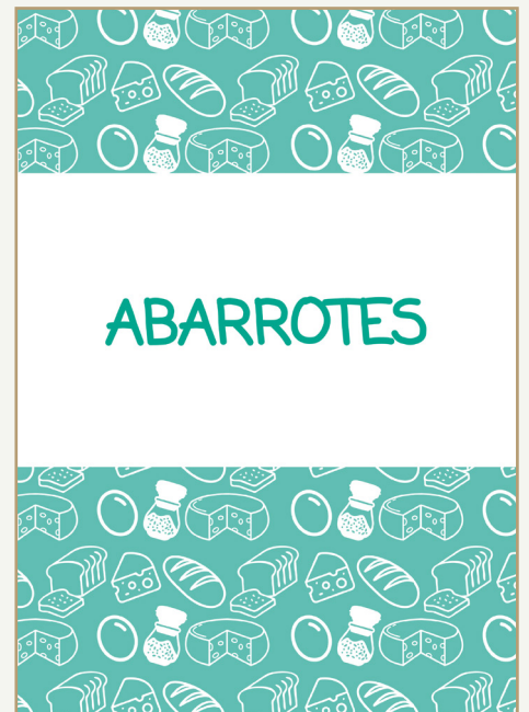
Fig.15 Segunda version del catalogo