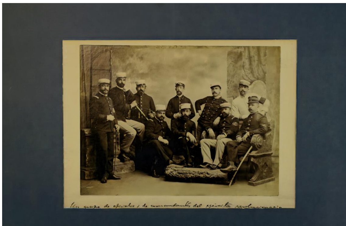
Fotografía, Un grupo de oficiales y de comandante del Ejército revolucionario (1891), editada.