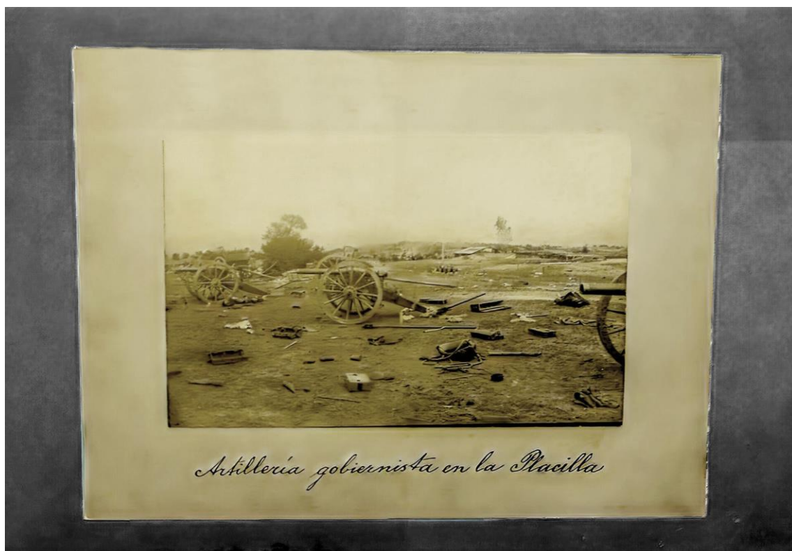
Fotografía, Artillería gubernista en la Placilla (1891), editada.