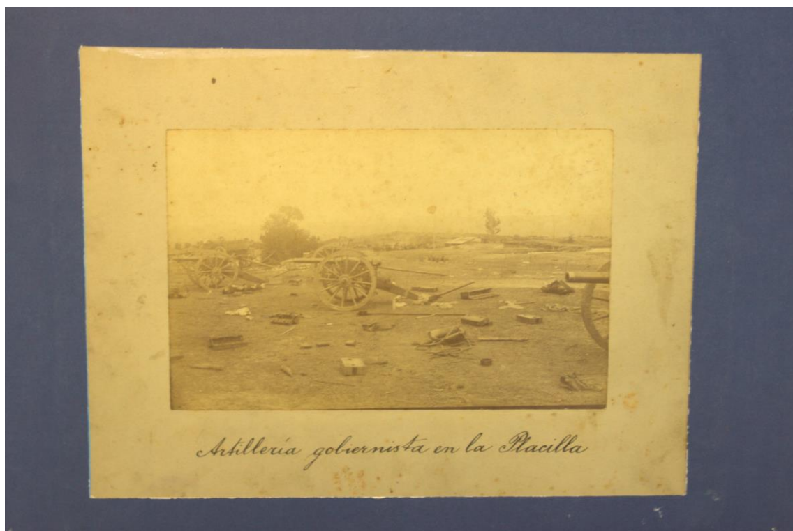
Fotografía, Artillería gobernista en la Placilla (1891), original.