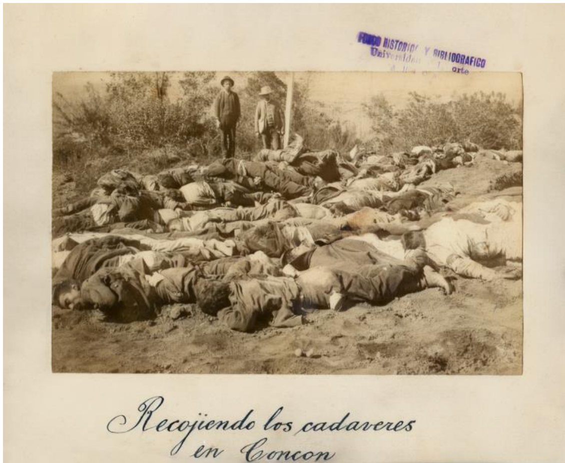
Fotografía, Recogiendo cadáveres en Concón (1891), editada.