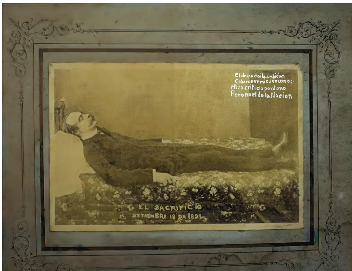
Fotografía, El supuesto cuerpo de José Manuel Balmaceda (1981), editada.