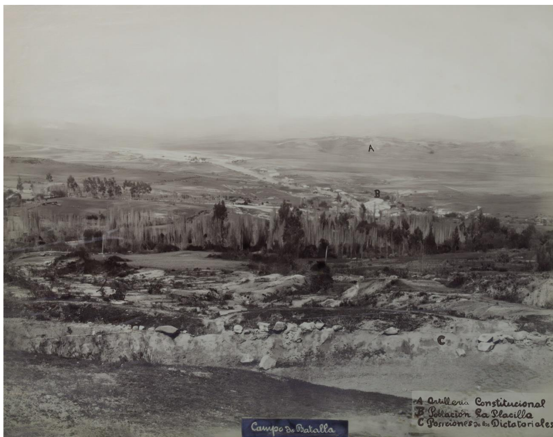
Fotografía, Campo de Batalla, Placilla (1981), editada.