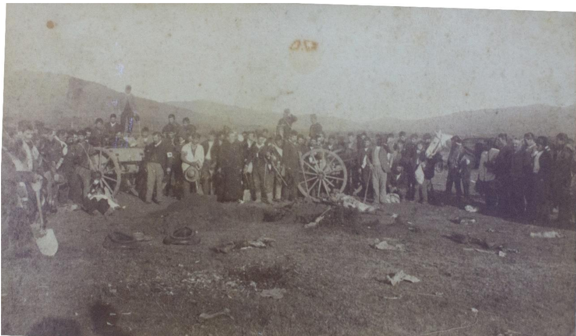
Fotografía, Funerales de un gobernista y de un opositor en Concón (1891), original.