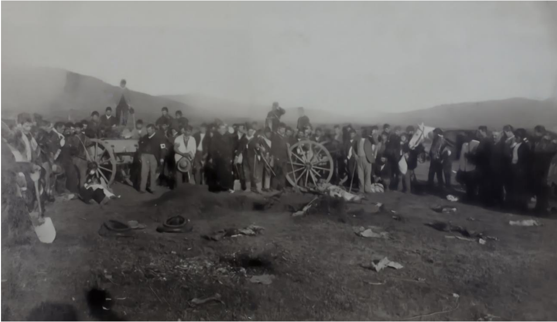
Fotografía, Funerales de un gobernista y de un opositor en Concón (1891), editada.