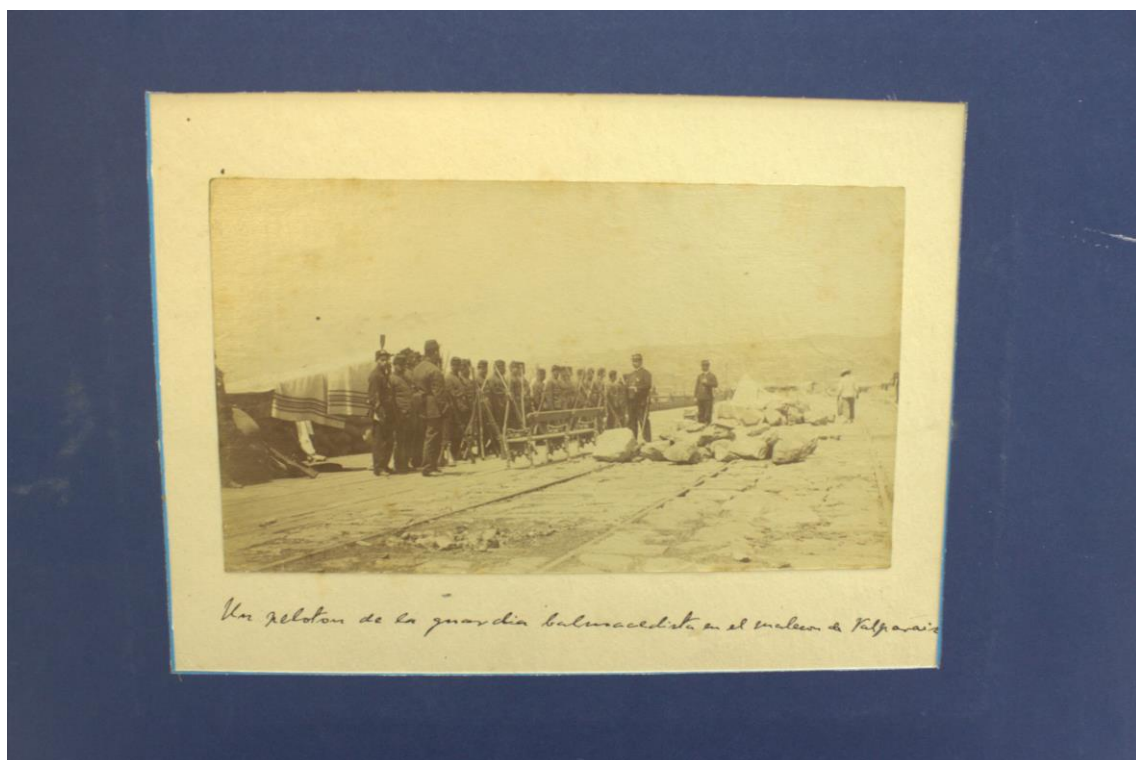
Fotografía, Un pelotón de la guardia balmacedista en el malecón de Valparaíso, (1891), original.