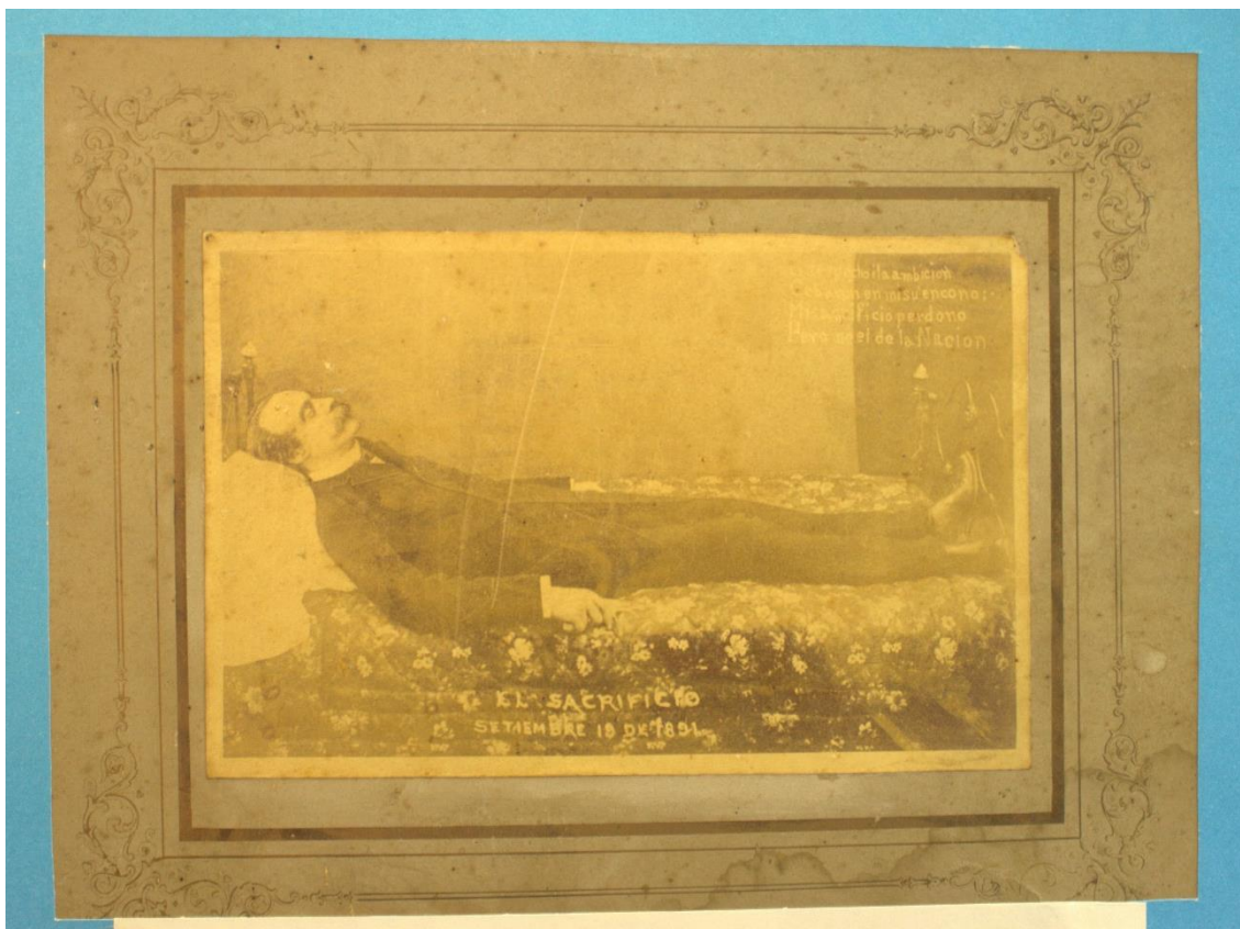
Fotografía, El supuesto cuerpo de José Manuel Balmaceda (1981), original.