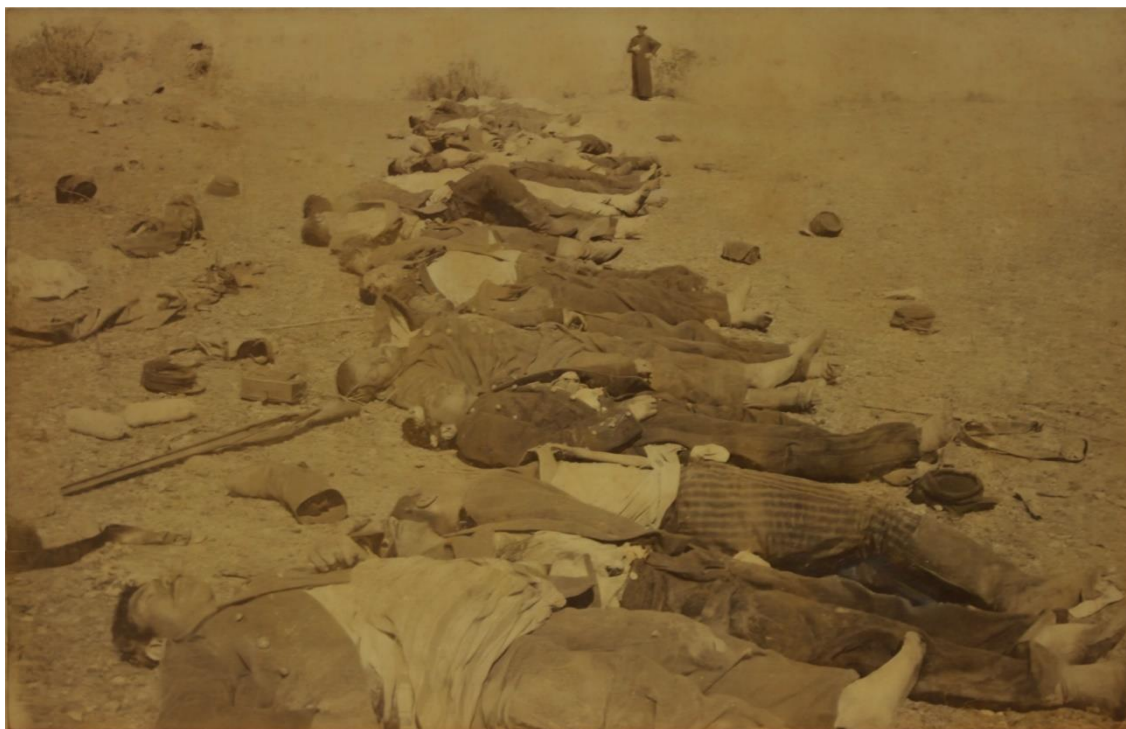
Fotografía, Cuerpos antes de la quema en la Placilla (1891), editada.