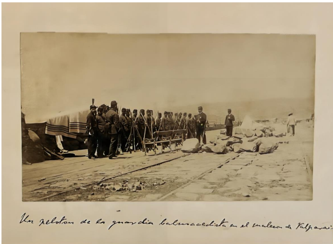
Fotografía, Un pelotón de la guardia balmacedista en el malecón de Valparaíso, (1891), editada.