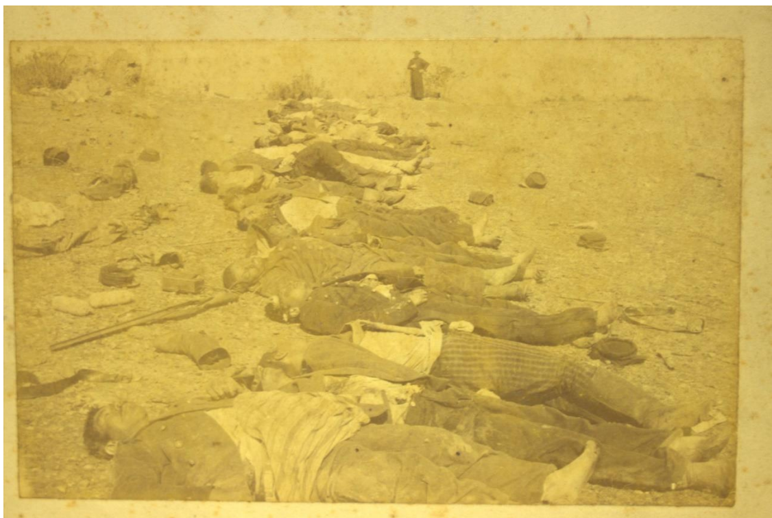
Fotografía, Cuerpos antes de la quema en la Placilla (1891), original.