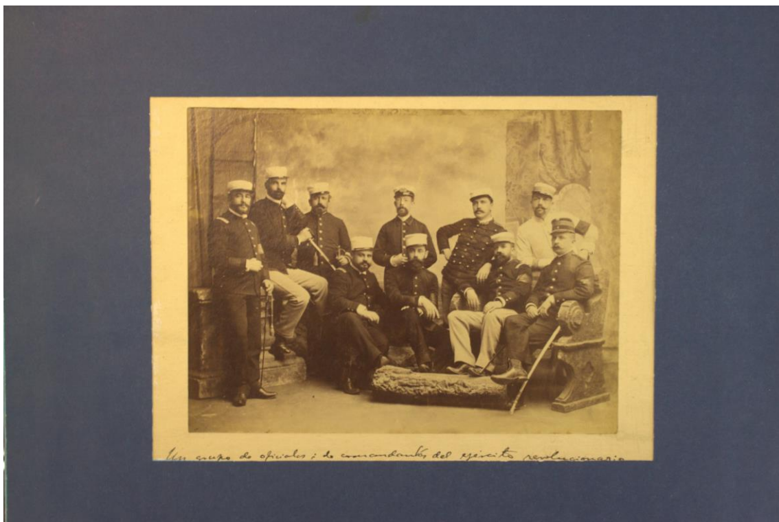
Fotografía, Un grupo de oficiales y de comandante del Ejército revolucionario (1891), original.