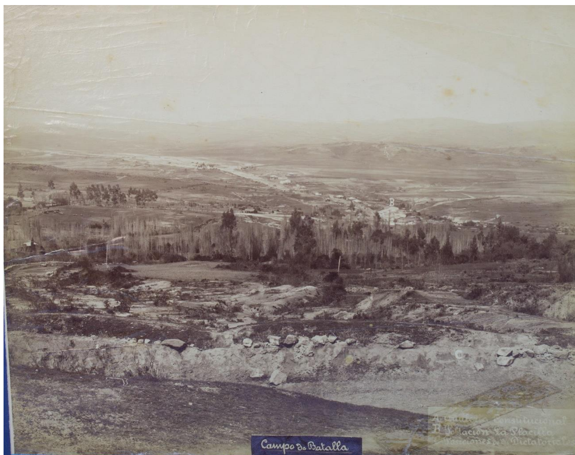
Fotografía, Campo de Batalla, Placilla (1981), original.