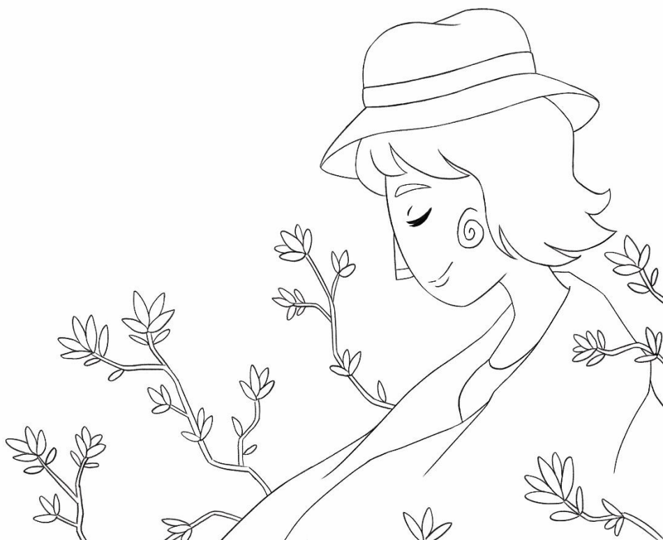
Figura 19: Tercer boceto del cuento “Embajadora de su tierra”.