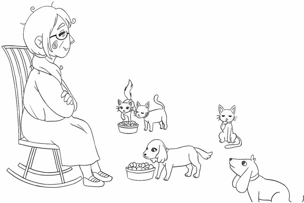
Figura 23: Séptimo boceto del cuento “Mi primer helado”.