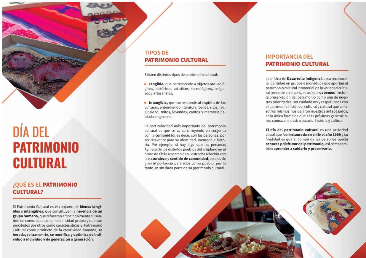
Figura 4: Tríptico del Día del Patrimonio Cultural (detrás)