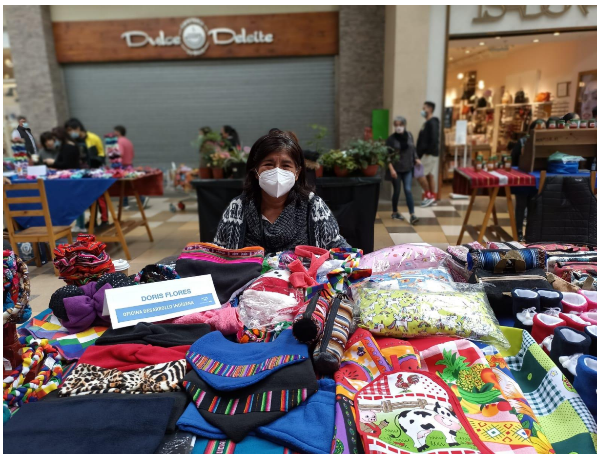
Figura 6: Sesión fotográfica para las Mujeres Emprendedoras Indígenas en Mallplaza Arica.

Sesión fotográfica para las Mujeres Emprendedoras Indígenas en Mallplaza Arica: Esta actividad consistió en fotografiar a las Mujeres Emprendedoras Indígenas en Mallplaza Arica, para este trabajo se utilizó una cámara de celular.