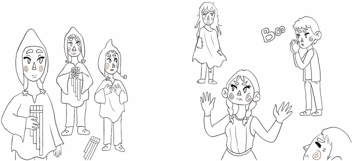
Figura 24: Octavo boceto del cuento “La leyenda del viejo andrajoso”.