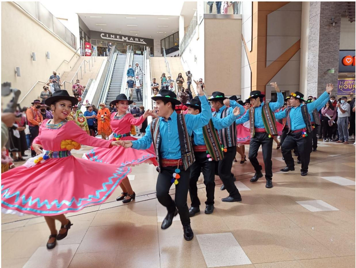
Figura 7: Fotografías para el Día del Patrimonio Cultural.

Fotografías para el Día del Patrimonio Cultural: Esta actividad consistió en realizar fotografías para el Día del Patrimonio Cultural en Mallplaza Arica, para este trabajo se utilizó una cámara de celular.