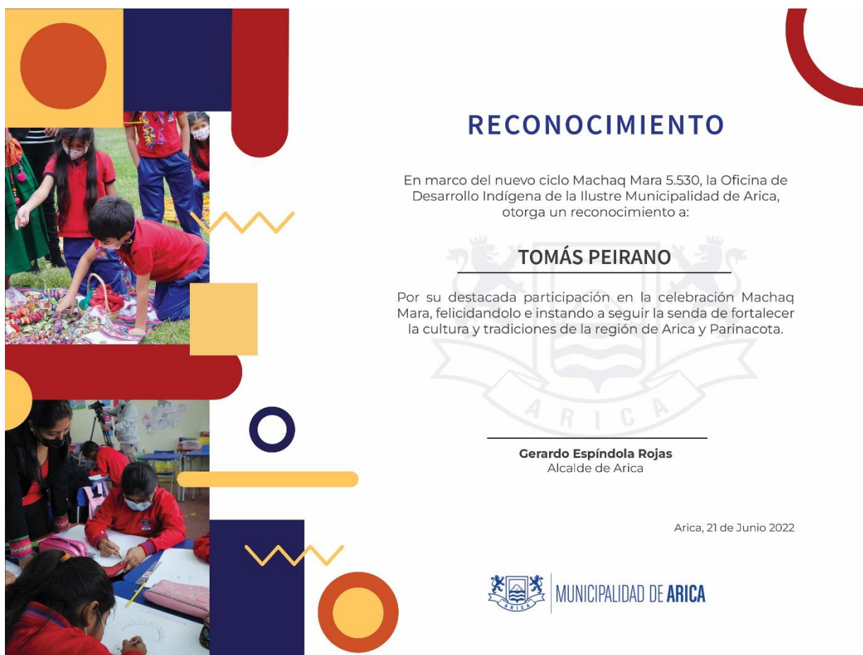
Figura 15: Diploma a niños de la Escuela Tucapel D21.

Diploma a niños de la Escuela Tucapel D21: Este trabajo consistió en crear un diploma a los niños de la Escuela Tucapel D21, se utilizó el software Adobe Photoshop e Illustrator para crear este diploma.