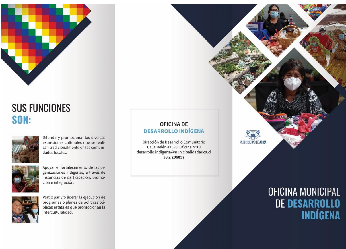
Figura 8: Tríptico de la Oficina Municipal de Desarrollo Indígena (delante)

Tríptico para la Oficina Municipal de Desarrollo Indígena: Este trabajo consistió en crear un tríptico que informe a las personas sobre qué es la Oficina Municipal de Desarrollo Indígena, se utilizó el software Adobe Photoshop e Illustrator para crear este tríptico.