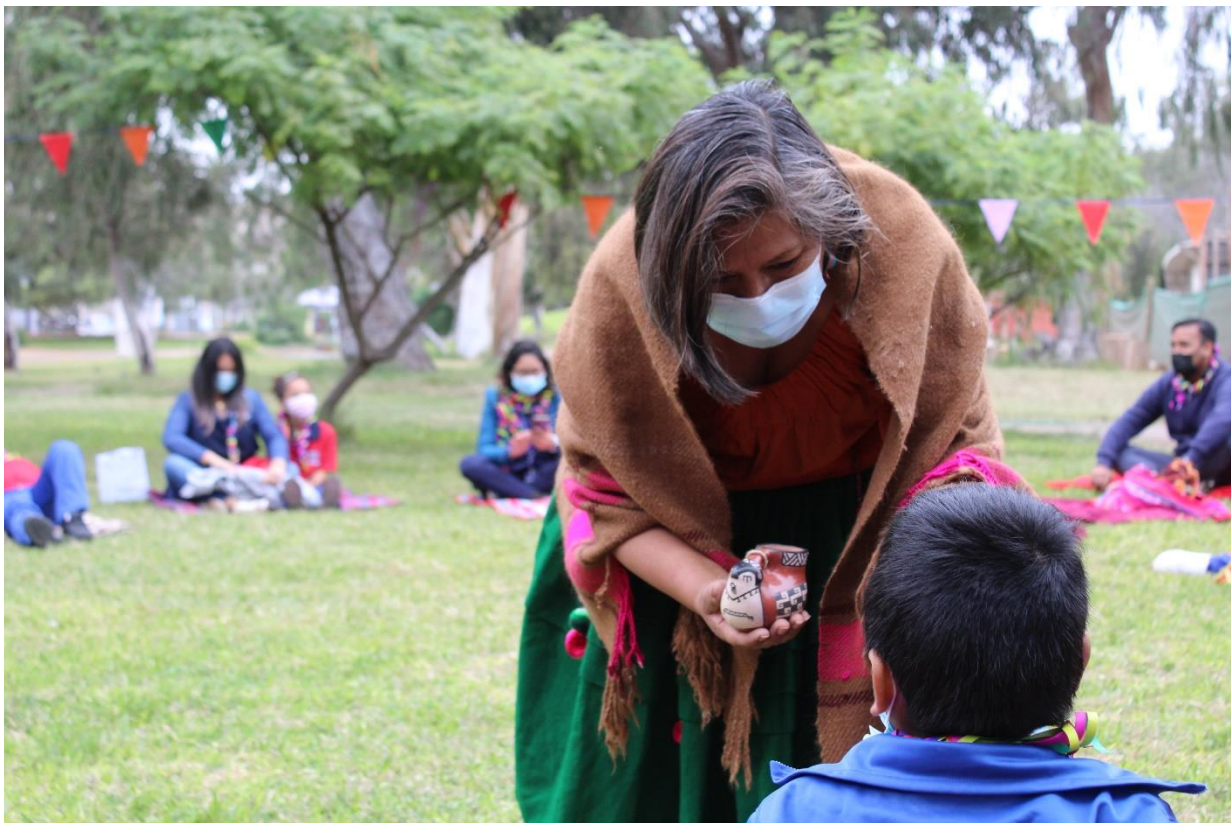
Figura 14: Fotografía del Parque Centenario por el Machaq Mara.

Fotografía a niños en el Parque Centenario por el Machaq Mara: Esta actividad consistió en realizar fotografías a los niños de la Escuela Tucapel D21 en el Parque Centenario por el Machaq Mara, para este trabajo se utilizó una cámara Canon Rebel T100.