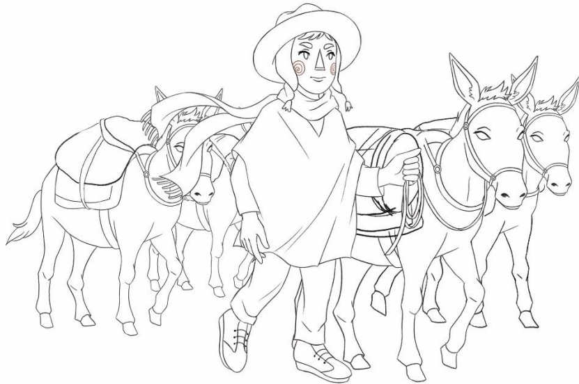
Figura 17: Primer boceto del cuento “El Arriero y el misterio de la sombra”.

Bocetos para libro de cuentos con temática Aymara: Este trabajo consistió en realizar ilustraciones para un libro de cuentos con temática Aymara, se utilizó el software Adobe Photoshop y una tableta gráfica de dibujo para crear estos bocetos.