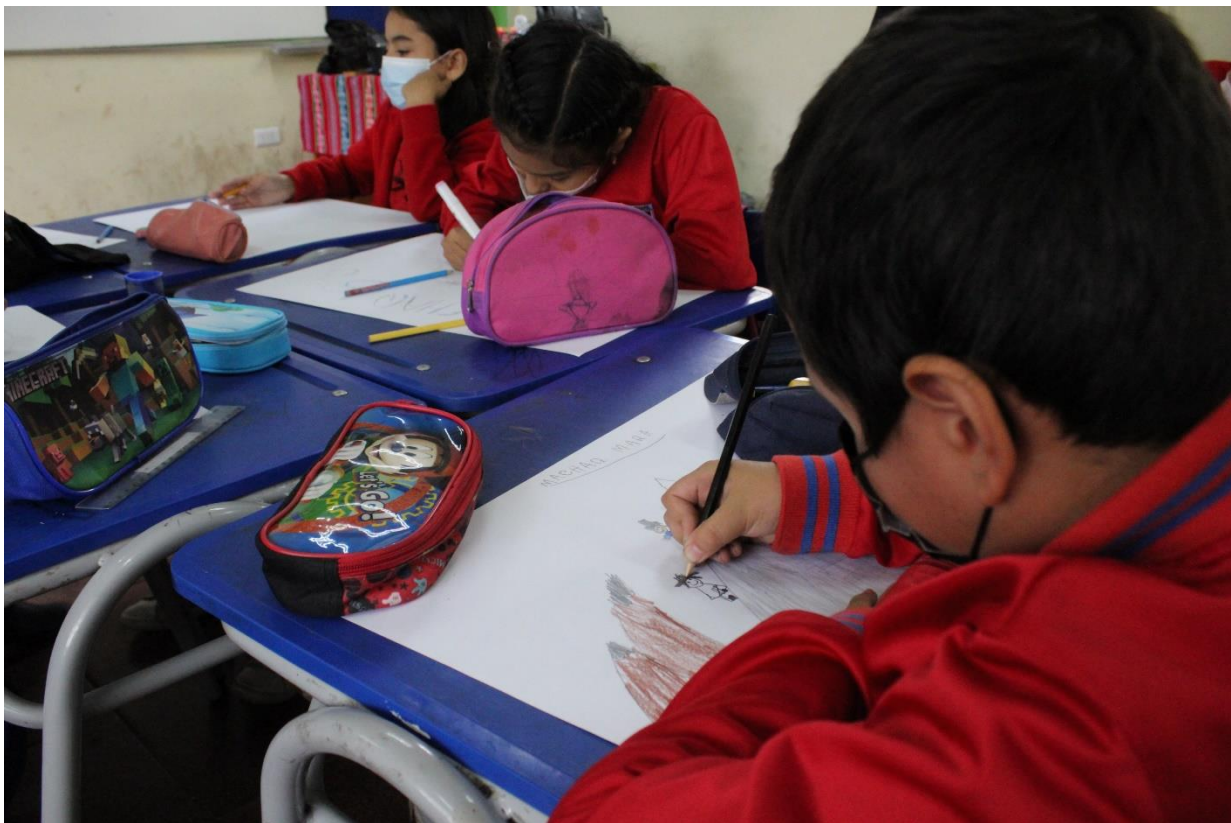
Figura 11: Sesión fotográfica a niños de la Escuela Tucapel D21.

Sesión fotográfica a niños de la Escuela Tucapel D21: Esta actividad consistió en realizar fotografías en la Escuela Tucapel D21 a los niños que estén dibujando sobre el Machaq Mara, para este trabajo se utilizó una cámara Canon Rebel T100.