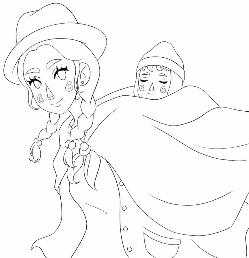
Figura 26: Decimo boceto para la portada del cuento “HITOS: TRADICIONES CULTURALES INDÍGENAS”.