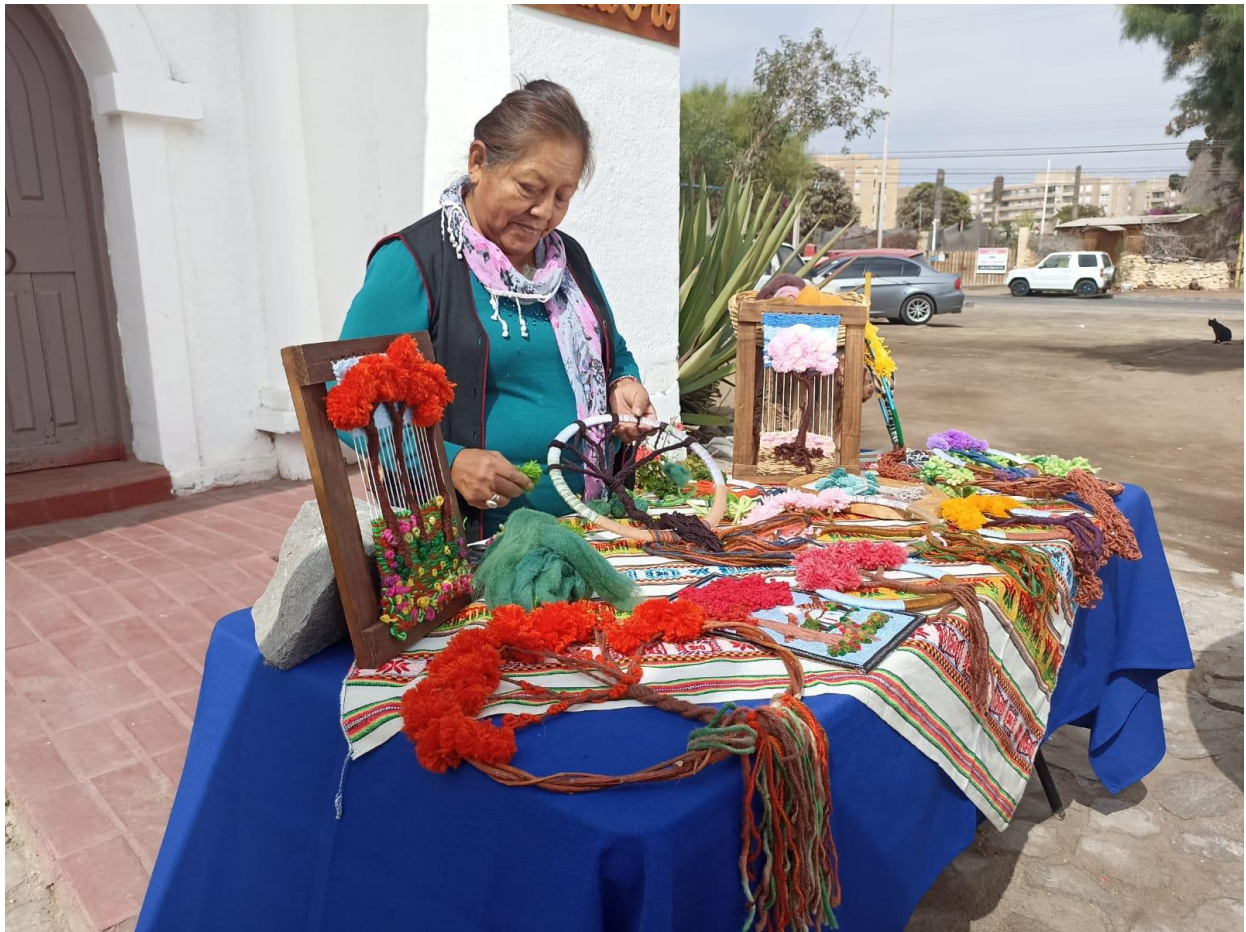
Figura 2: Sesión fotográfica a Mujeres Emprendedoras Indígenas

Sesión fotográfica a las Mujeres Emprendedoras Indígenas: Esta actividad consistió en fotografiar a las Mujeres Emprendedoras Indígenas en distintas localidades, para este trabajo se utilizó una cámara de celular.