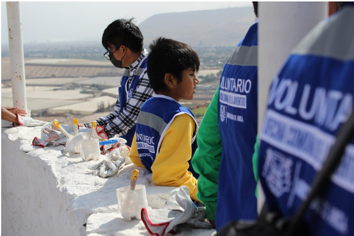
Figura 10: Fotografías para el Cerro Sagrado.

Fotografías para el Cerro Sagrado: Esta actividad consistió en realizar fotografías para el equipo de voluntarios de limpieza del Cerro Sagrado, para este trabajo se utilizó una cámara Canon Rebel T100.