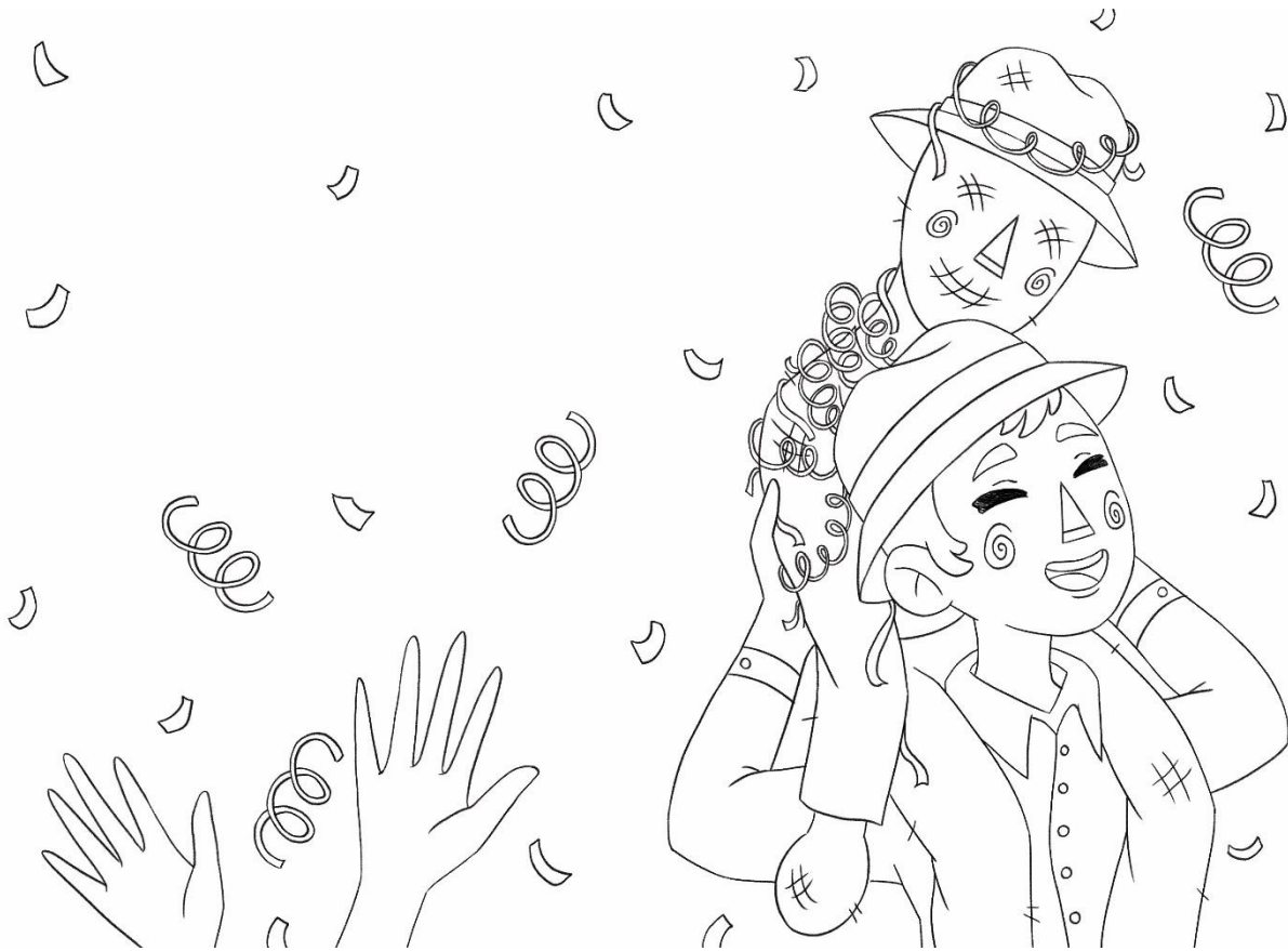
Figura 20: Cuarto boceto del cuento “Ño Carnavalon”.