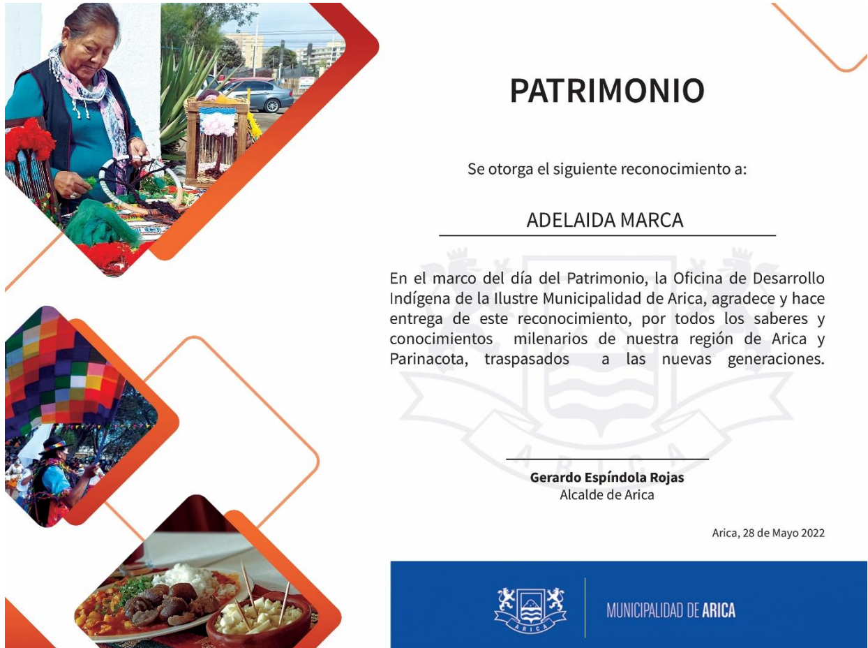
Figura 5: Diploma para las Mujeres Emprendedoras Indígenas.

Diploma a las Mujeres Emprendedoras Indígenas: Este trabajo consistió en crear un diploma a las Mujeres Emprendedoras Indígenas, este diploma se les entregó a las emprendedoras el Día del Patrimonio Cultural, se utilizó el software Adobe Photoshop e Illustrator para crear este diploma.