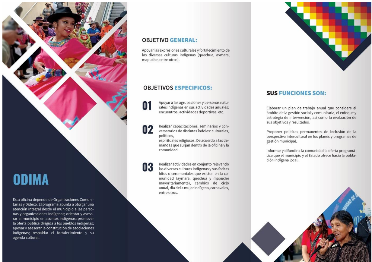
Figura 9: Tríptico de la Oficina Municipal de Desarrollo Indígena (detrás)