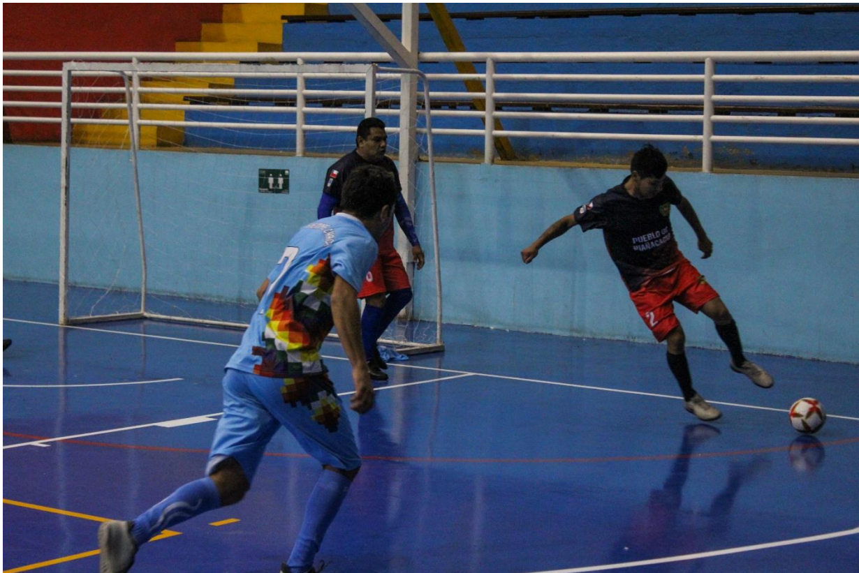
Figura 16: Fotografías para el Campeonato Futsal.

Fotografías para el Campeonato Futsal: Esta actividad consistió en realizar fotografías para el Campeonato Futsal en el Epicentro 1, para este trabajo se utilizó una cámara Canon Rebel T100.