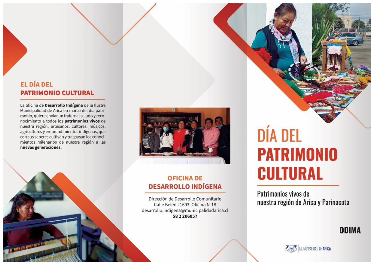
Figura 3: Tríptico del Día del Patrimonio Cultural (delante)

Tríptico del Día del Patrimonio Cultural: Este trabajo consistió en crear un tríptico que informe sobre que es Día del Patrimonio Cultural, también se repartió este tríptico a las personas el día de su celebración, se utilizó el software Adobe Photoshop e Illustrator para crear este tríptico.