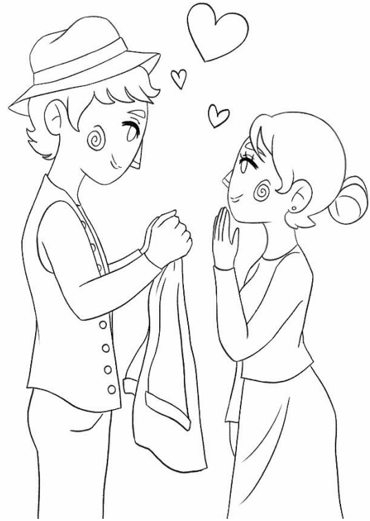
Figura 22: Sexto boceto del cuento “Amor eterno”.