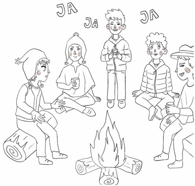
Figura 25: Noveno boceto del cuento “Un niño desobediente”.