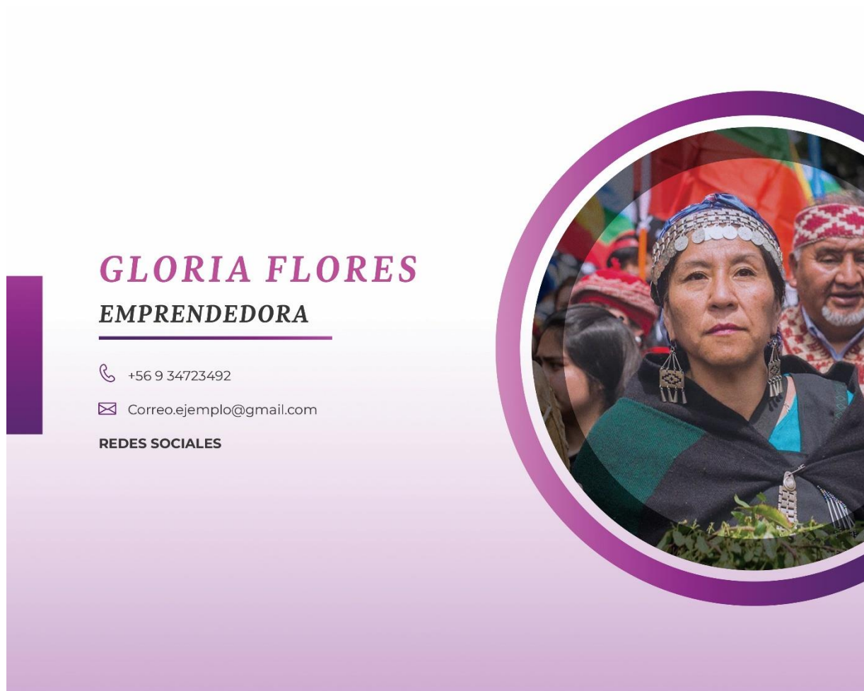
Figura 12: Tarjeta de presentación para las Mujeres Emprendedoras Indígenas (delante)

Tarjeta de presentación para las Mujeres Emprendedoras Indígenas: Este trabajo consistió en crear una tarjeta de presentación para las Mujeres Emprendedoras Indígenas, se utilizó el software Adobe Photoshop e Illustrator para crear este tríptico.