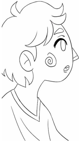
Figura 18: Segundo boceto del cuento “Mi mundo”.