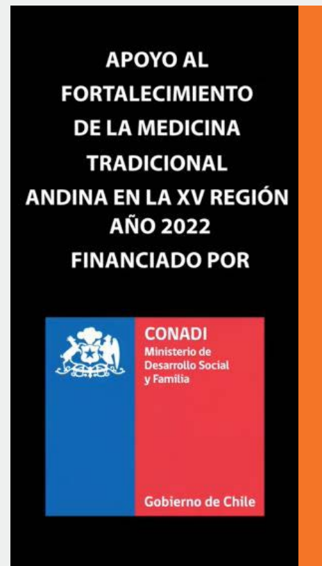
Fig 8. Captura de un reel realizado por mí a pedido de Romina Sir.