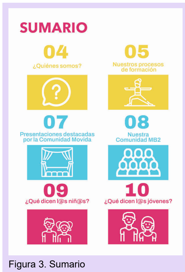
Figura 3. Sumario

El sumario sigue los colores base buscando ser simple pero llamativo al representar cada sección con un icono distinto el cual hace referencia al contenido de esta.