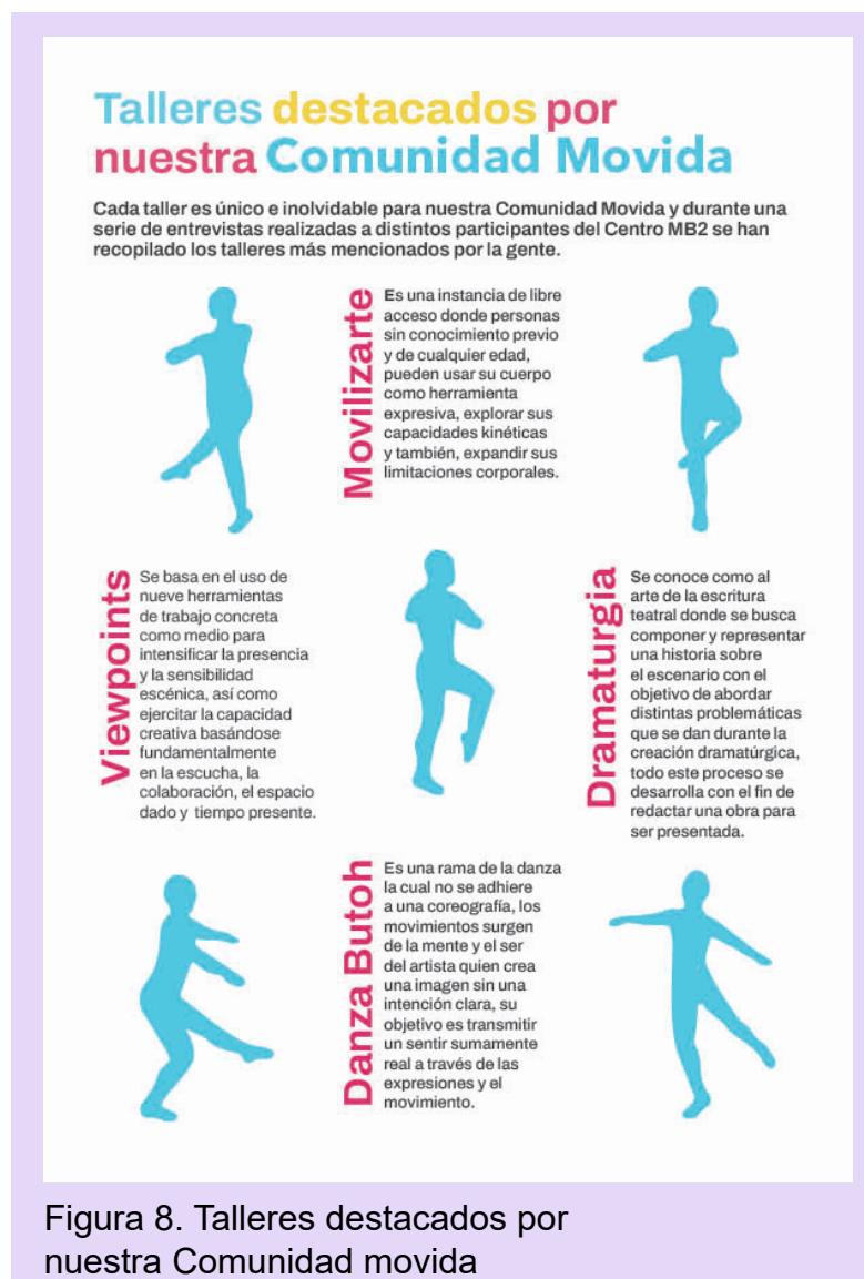
Figura 8. Talleres destacados por nuestra Comunidad movida

En esta página se busca destacar directamente cuales fueron los talleres destacados durante las entrevistas realizadas, se busca dar importancia a los talleres agregándose una introducción breve, además se implementan siluetas de una persona realizando un paso para destacar el movimiento que se hace al practicar los talleres.