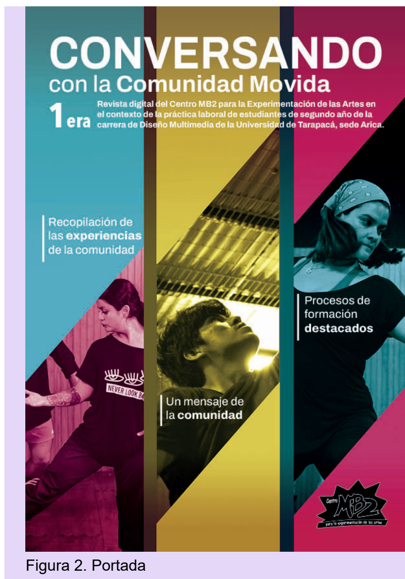
Figura 2. Portada

Se busco como objetivo principal que esta mostrara lo que es la comunidad movida a través de fotografías donde se ve a la gente participando en los variados talleres del Centro MB2, junto a esto se implementaron los colores de la paleta base dejándolos en un tono saturado.