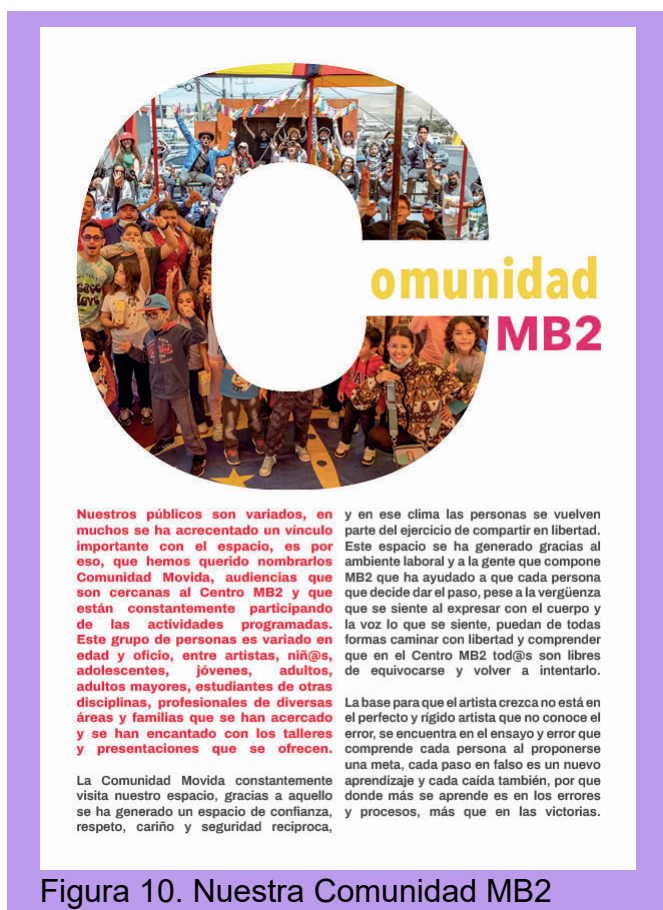
Figura 10. Nuestra Comunidad MB2

MB2, dentro de esta página se implementa lo que sería una silueta de una persona escapando de un icono de covid y otro de una hora junto con lo que sería un icono de un ruido molesto o fuerte, junto a esto se agrega información la cual es referenciada en las imágenes.