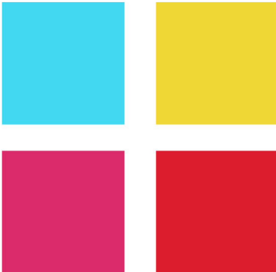
Figura 1. Paleta de colores

Parara el desarrollo de la revista se estableció una paleta de colores base la cual contiene colores vivos los cuales representan la comunidad MB2: