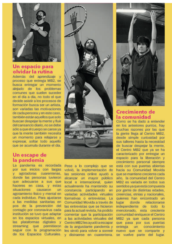
Figura 11. Nuestra Comunidad MB2