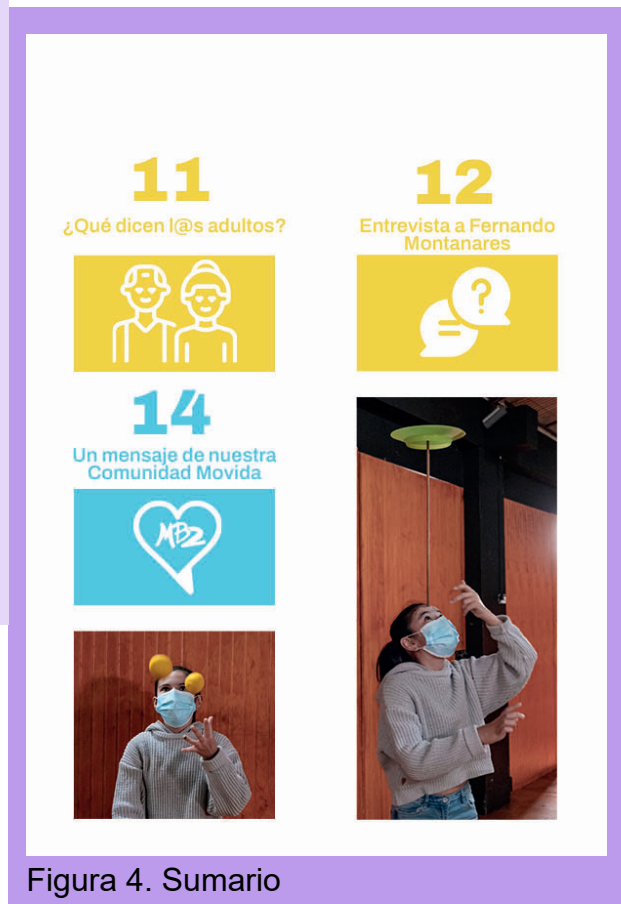
Figura 4. Sumario