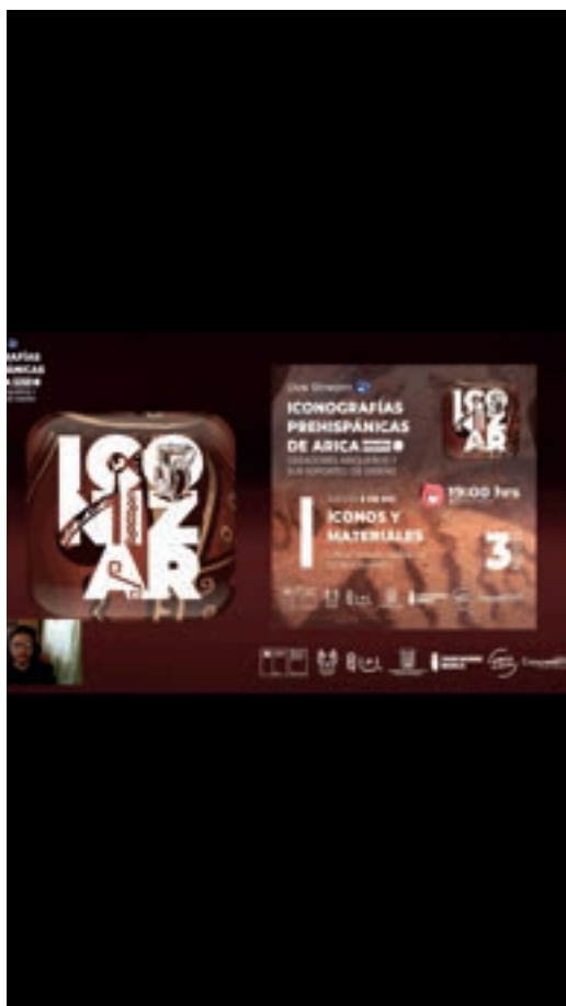
Presentación de la APP ICONIZAR.