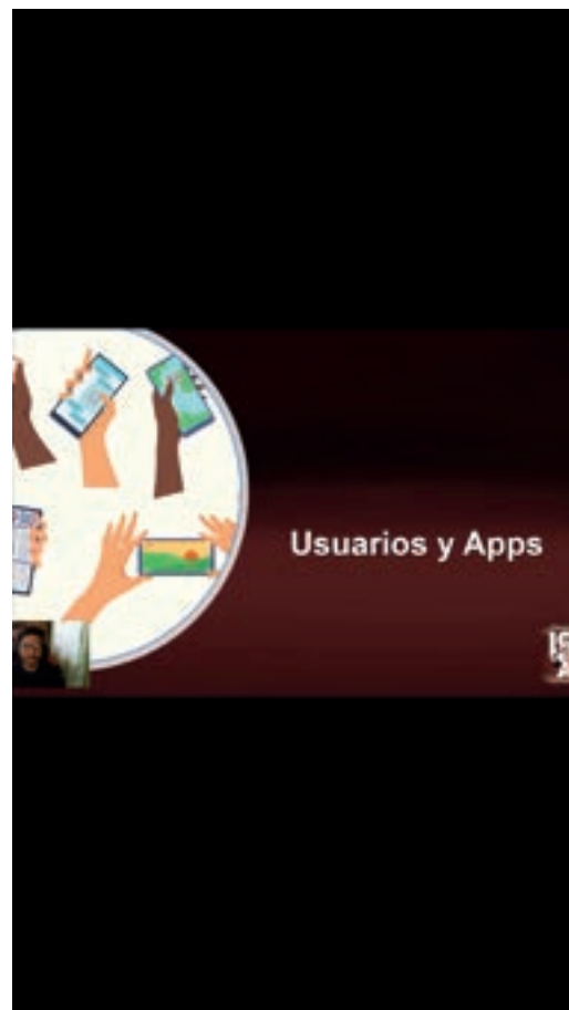
Presentación para Usuarios y Apps próximas de Qiri.

Extractos del vídeo original de la presentación de la nueva APP Iconizar.