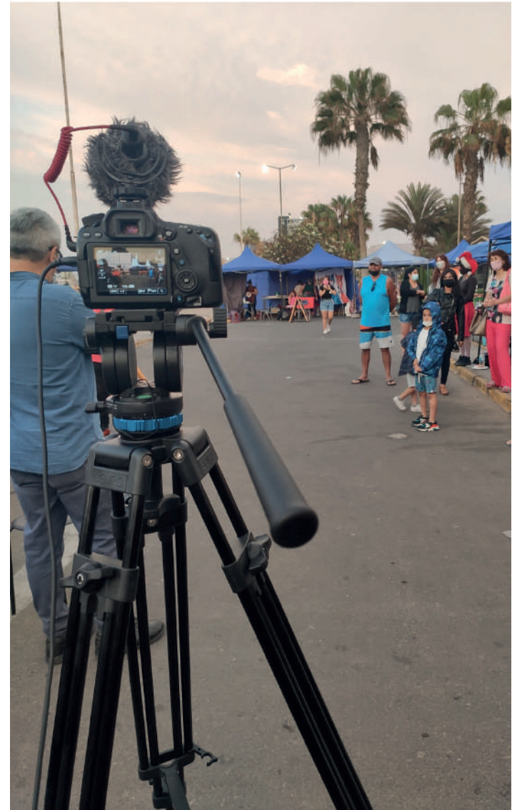
Nota. Fotografía del trabajo . autor (Alexis Cayo Choque).