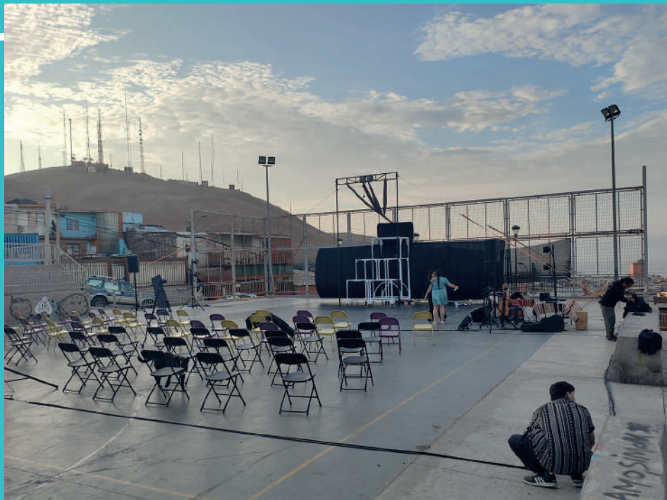
Figura 7 Fotografía

Primer y segundo evento, asistente de cámara