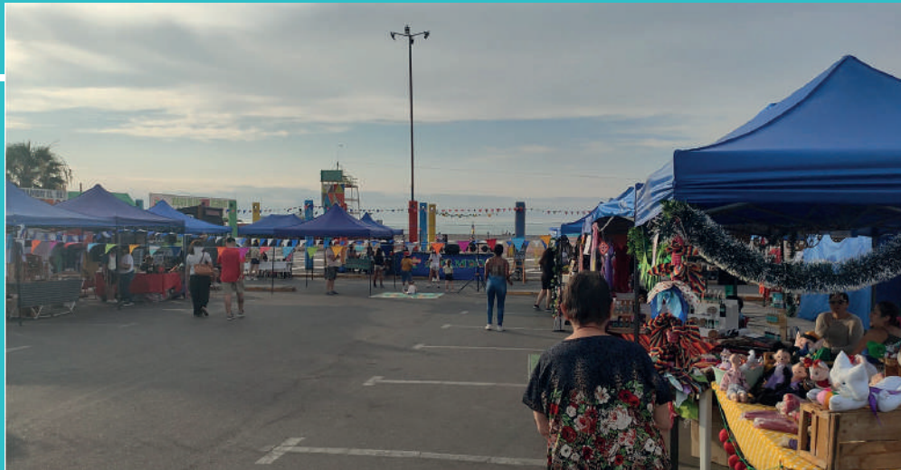
Figura 9 Fotografía

Nota. Fotografía del trabajo . autor (Alexis Cayo Choque).