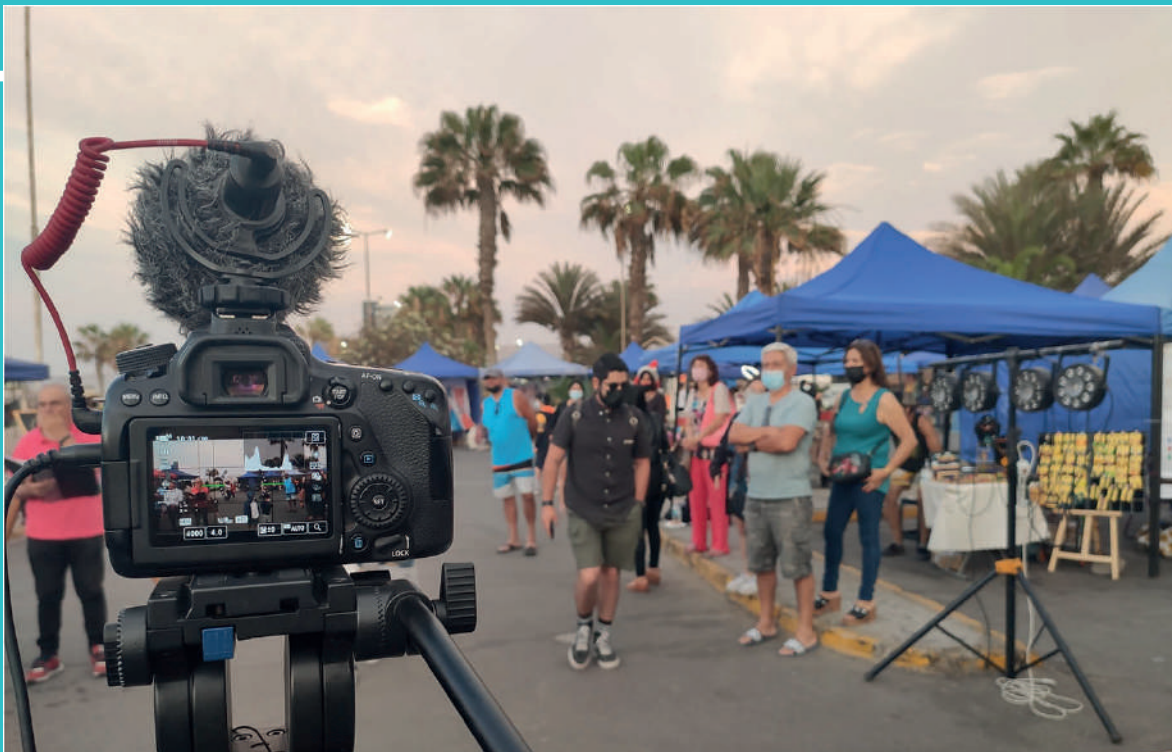
Figura 8 Fotografía