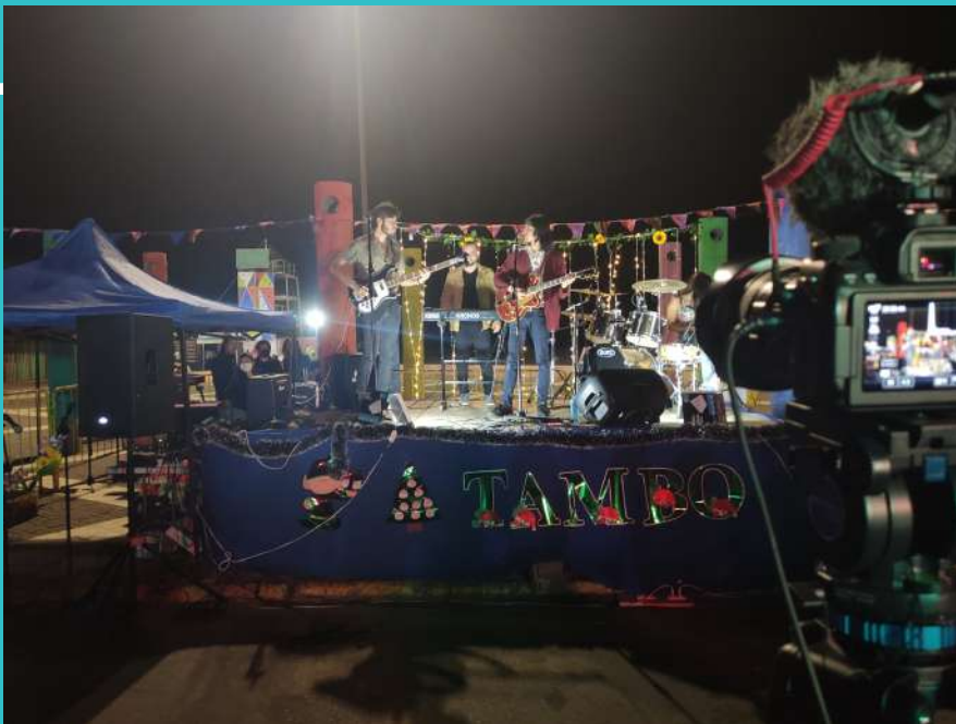
Figura 10 Fotografía