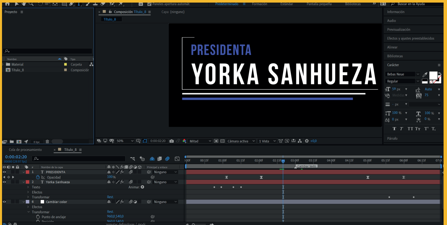
Captura del proyecto de banners - Affet effects