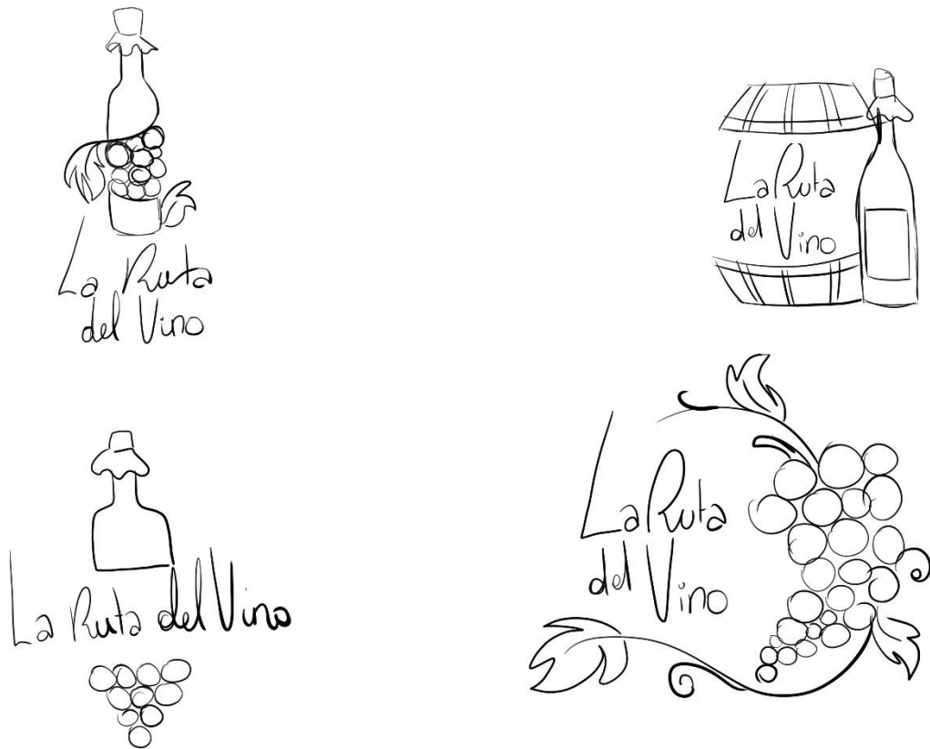
Figura 12: Bocetos sobren logotipo "La Ruta del Vino".