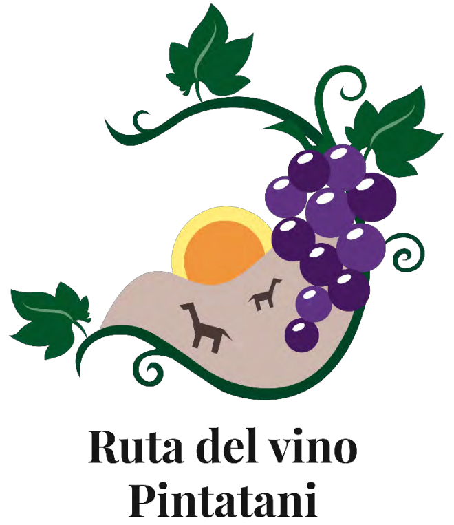
Figura 17: Logotipo a color según los arreglos que se pidieron para el logotipo para "La Ruta del Vino".