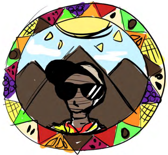
Figura 5: Segundo boceto para la realización de un logotipo en la parte frontal de una polera sobre la Comunidad Indígena de Guatanave.