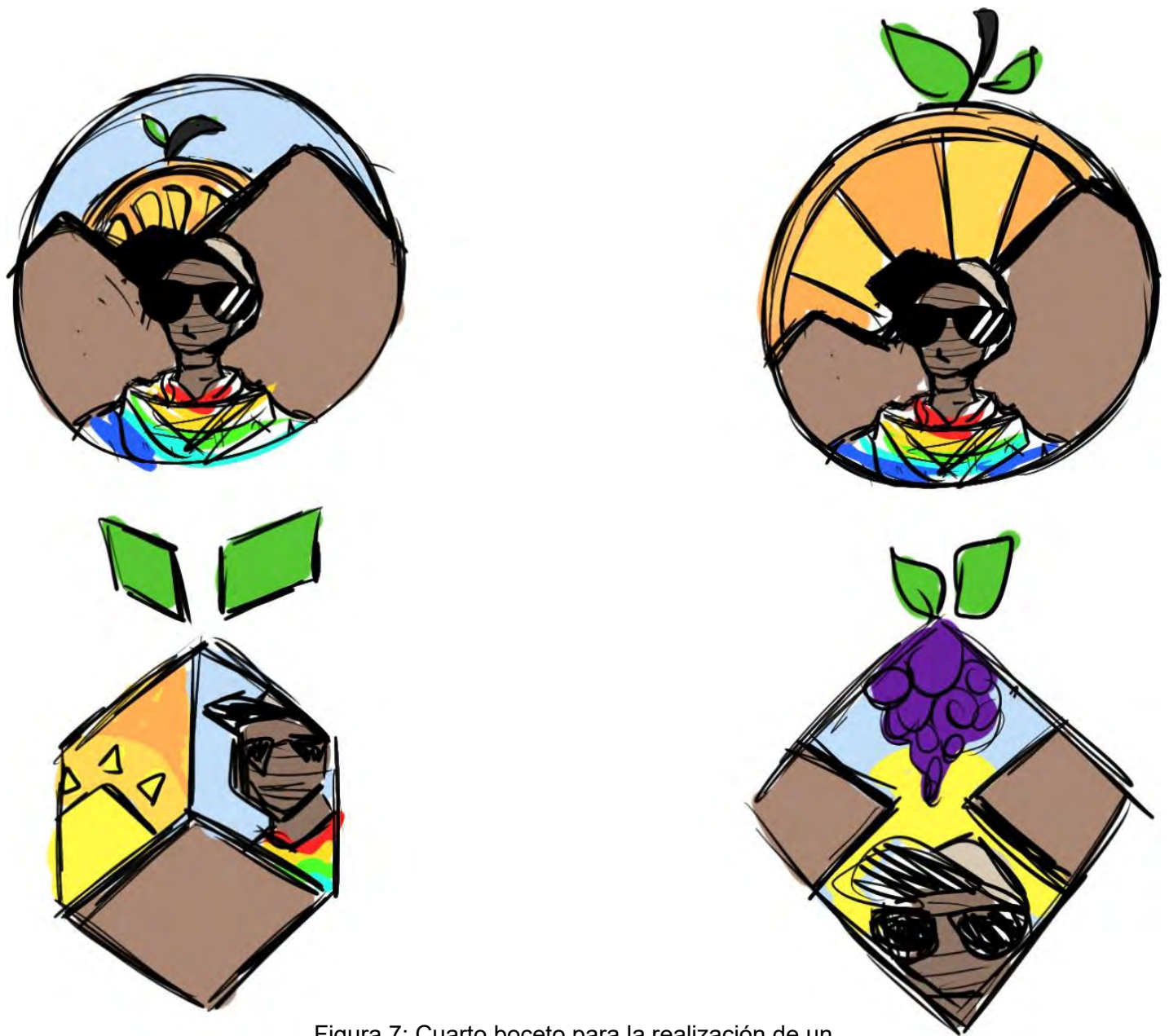
Figura 7: Cuarto boceto para la realización de un logotipo en la parte frontal de una polera sobre la Comunidad Indígena de Guatanave.