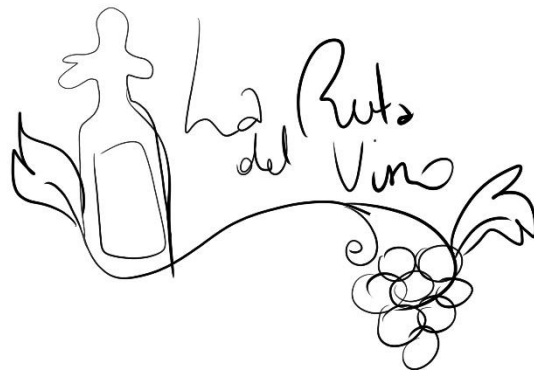
Figura 13: Bocetos sobren logotipo "La Ruta del Vino".