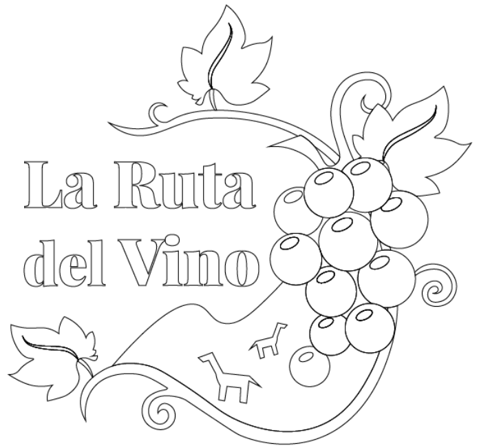
Figura 14: Logos de acuerdo a los bocetos escogidos para realizar un logotipo para "La Ruta del Vino".