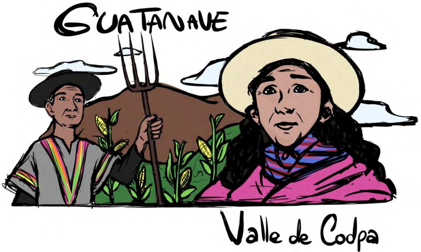
Figura 3: Tercer boceto sobre Ilustración en la parte trasera de una polera sobre Guatanave, Valle de Cudpa.