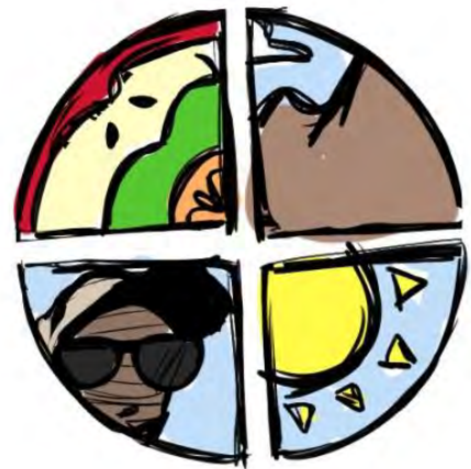
Figura 8: Quinto boceto para la realización de un logotipo en la parte frontal de una polera sobre la Comunidad Indígena de Guatanave.