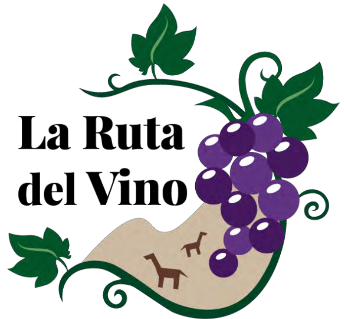
Figura 15: Logos a color de acuerdo a los bocetos escogidos para realizar un logotipo para "La Ruta del Vino".