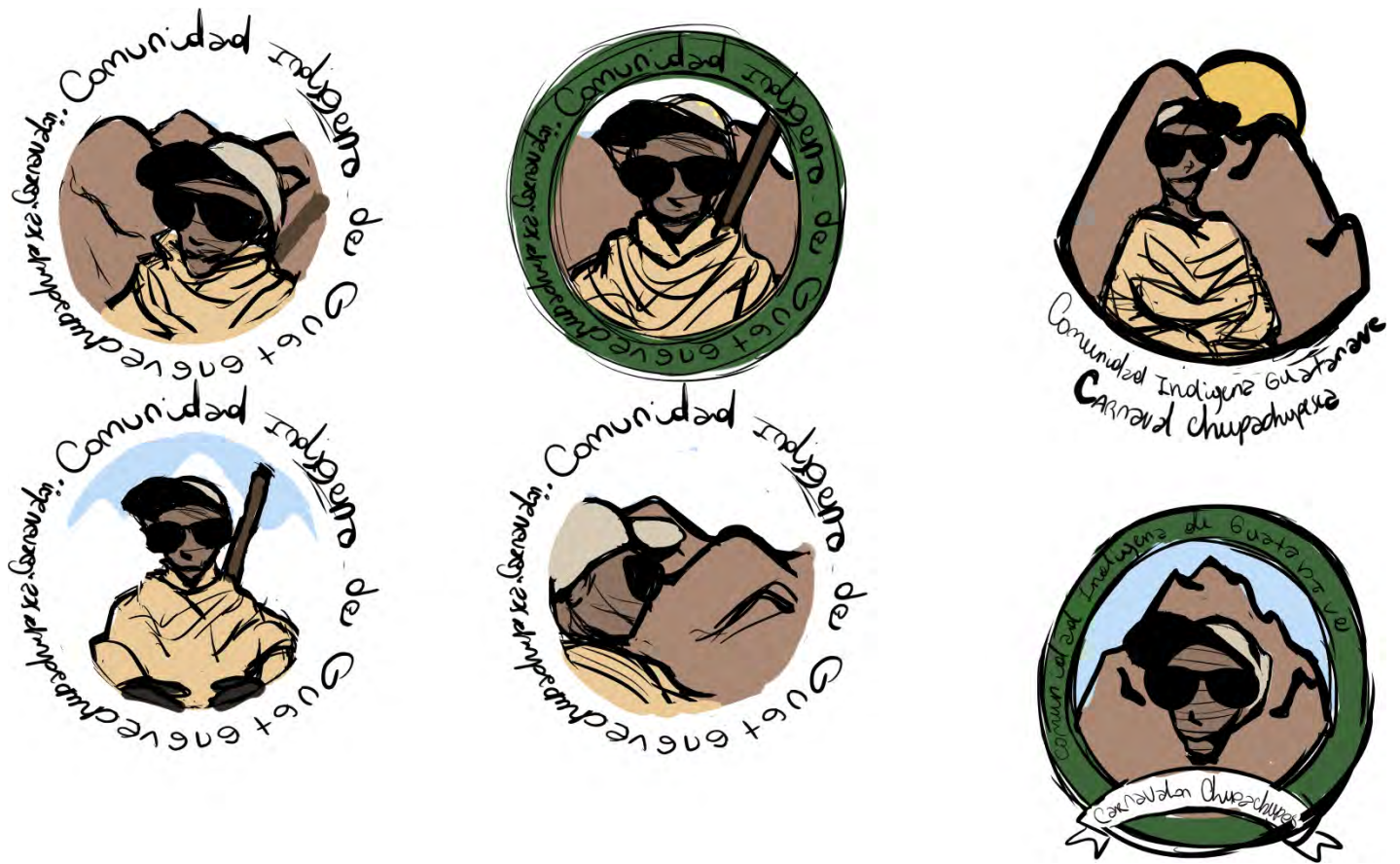
Figura 4: Primero boceto para la realización de un logotipo en la parte frontal de una polera sobre la Comunidad Indígena de Guatanave.