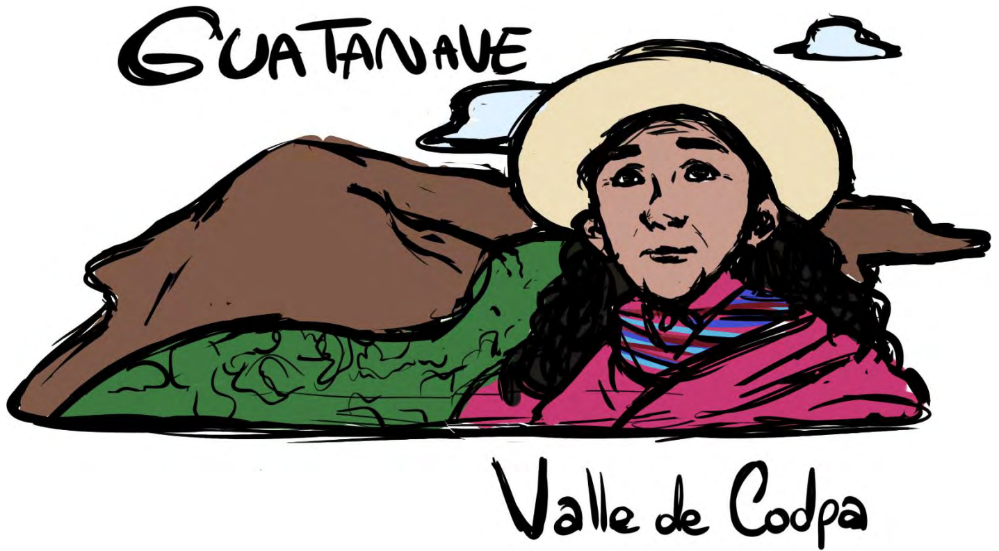
Figura 1: Primer bocetos sobre Ilustración en la parte trasera de una polera sobre Guatanave, Valle de Codpa.