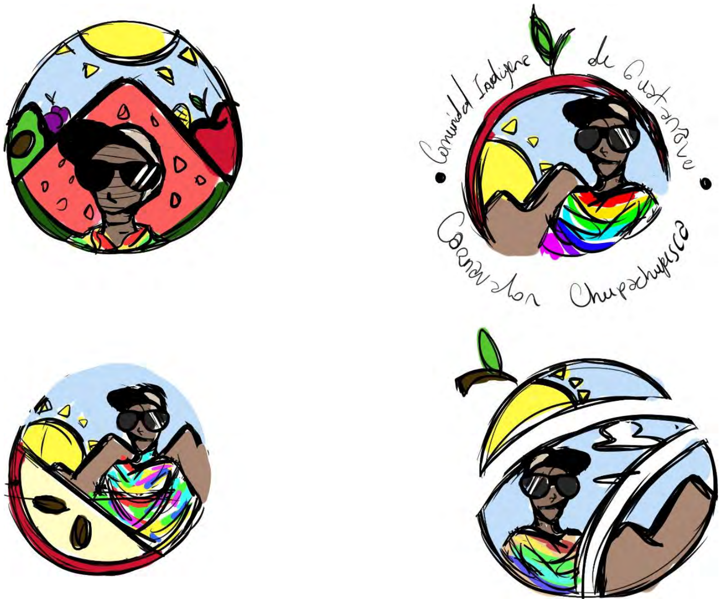
Figura 6: Tercer boceto para la realización de un logotipo en la parte frontal de una polera sobre la Comunidad Indígena de Guatanave.