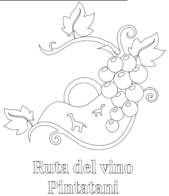
Figura 16: Logotipo según los arreglos que se pidieron para el logotipo para "La Ruta del Vino".