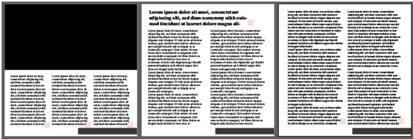
Figura 2: Segunda parte de la primera propuesta para el libro de imagines