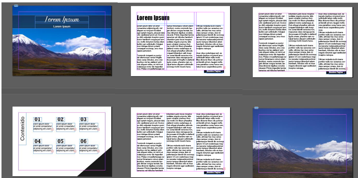
Figura 3: Segunda propuesta para el libro de imágenes.