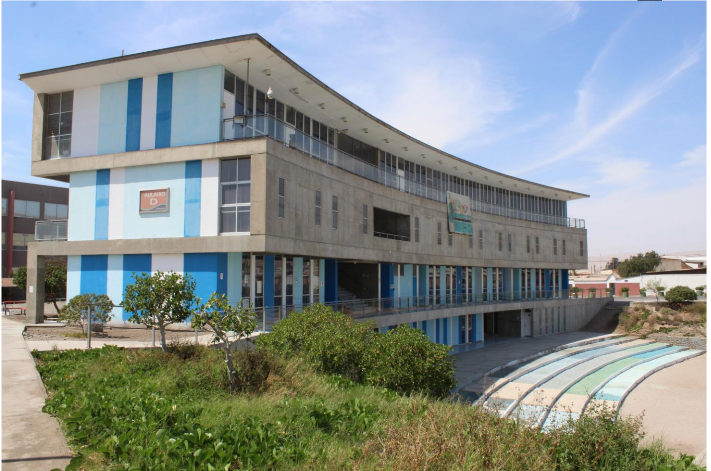
Figura 5. Aulario D (autoría)