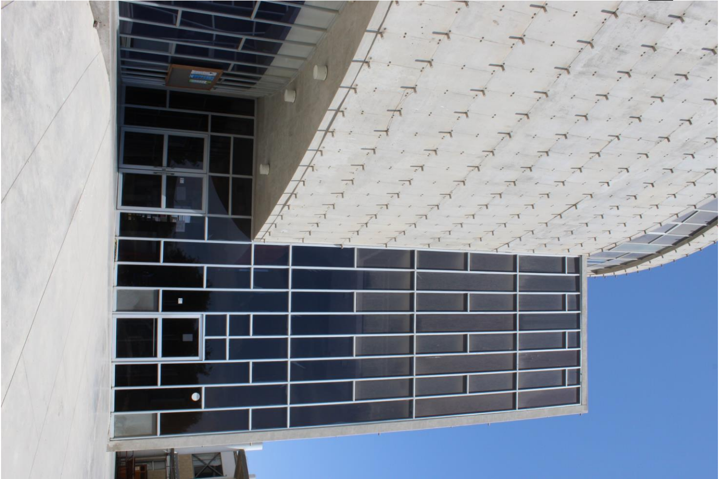
Figura 7. Biblioteca central (autoría)