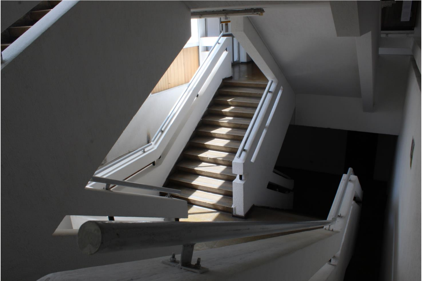
Figura 3. Escaleras (autoría)