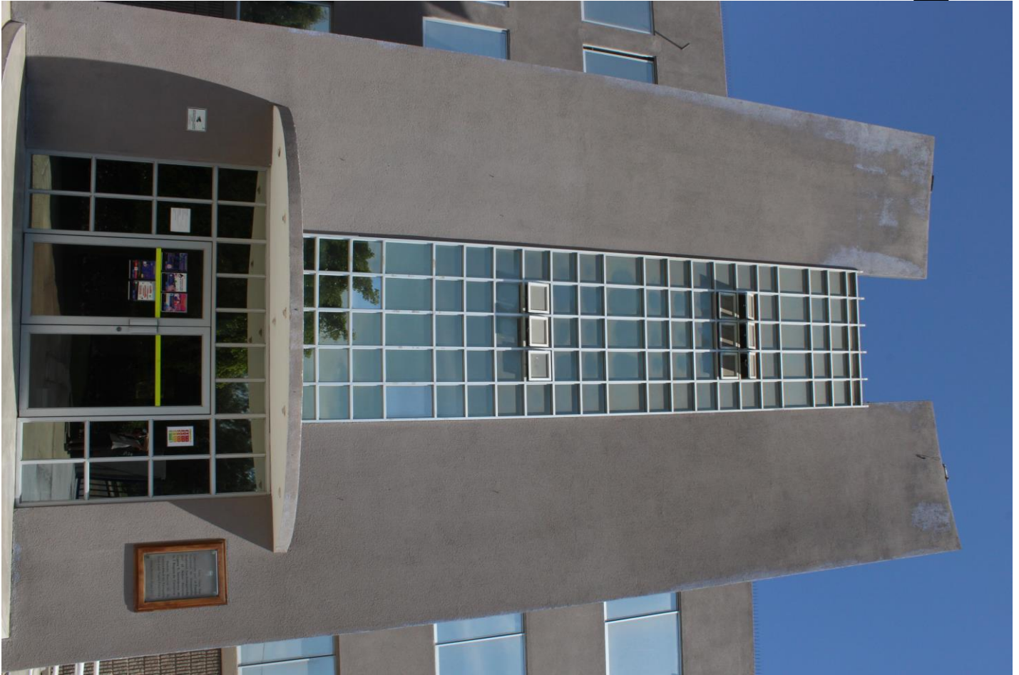
Figura 6. Facultad de Administración y Economía (autoría)