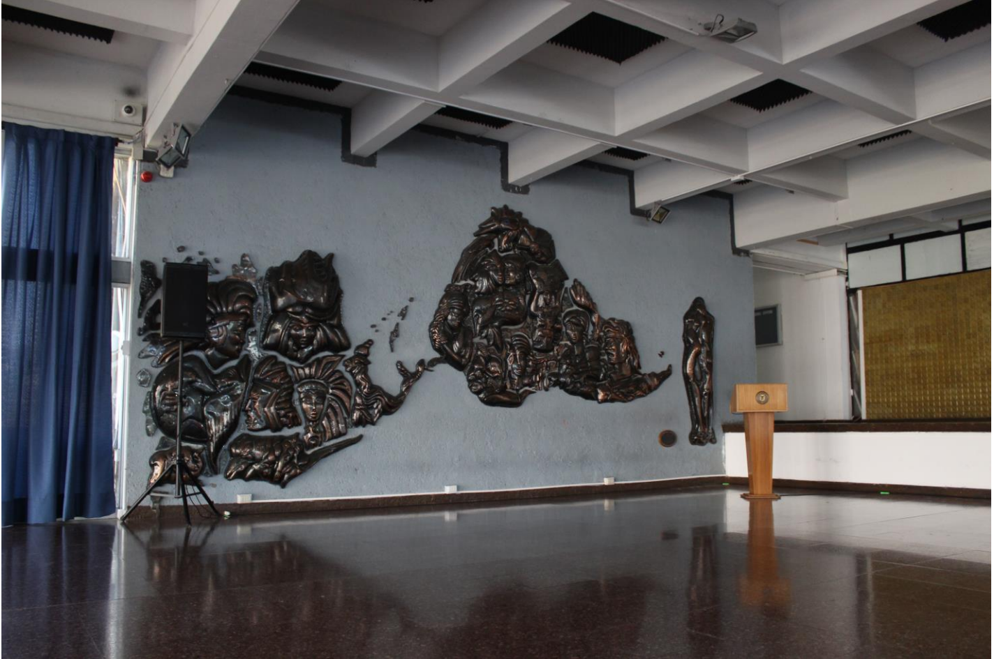
Figura 4. Hall central (autoría)