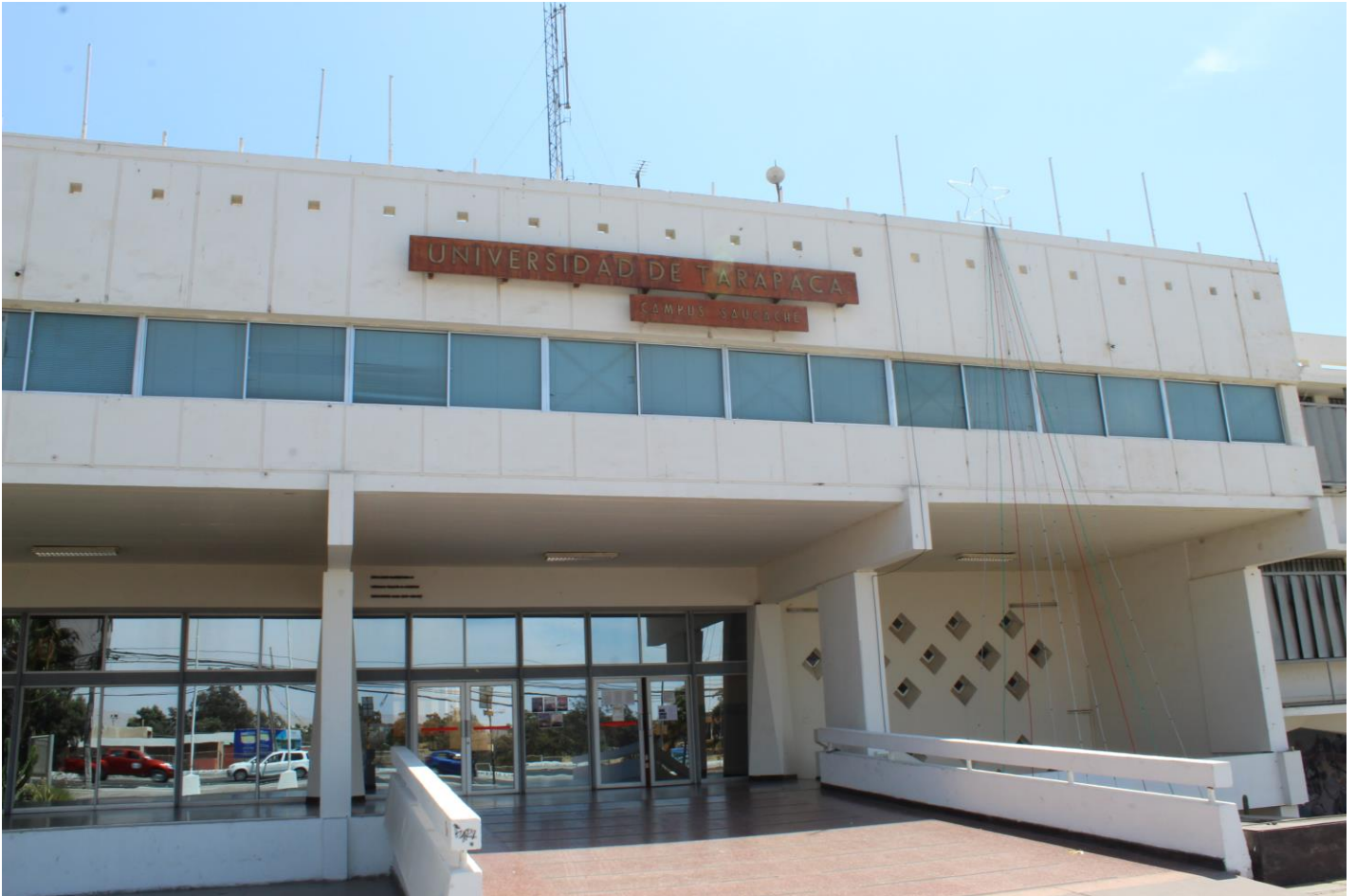
Figura 2. Entrada UTA (autoría)

Estas son algunas de las fotos sacadas de la práctica