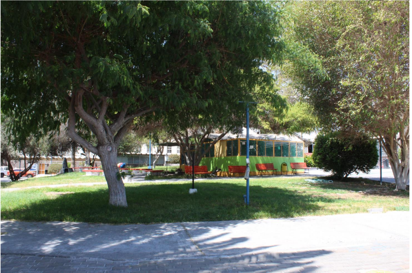
Figura 4. Parque (autoría)