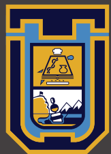
UNIVERSIDAD DE TARAPACÁ Universidad del Estado