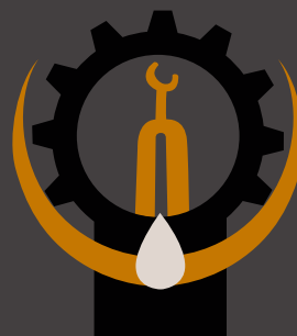
Departamento de Ingeniería Mecánica