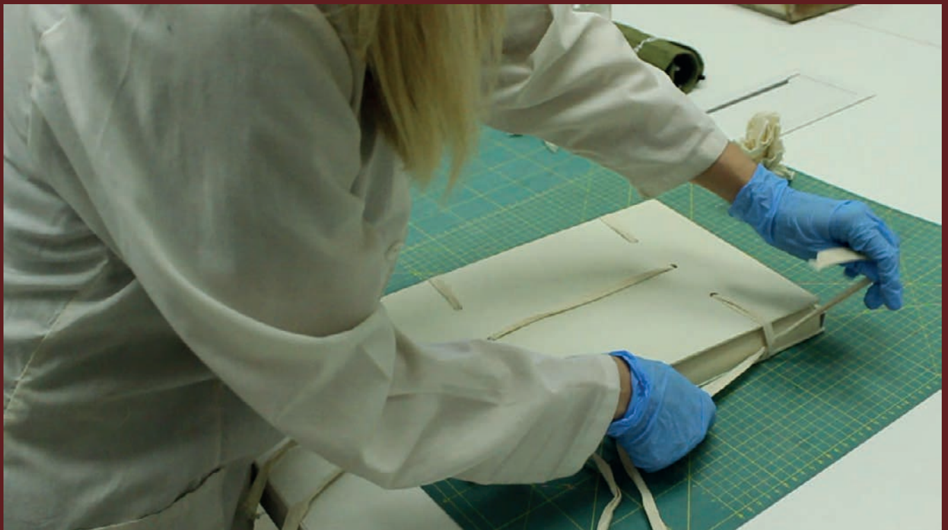
2. Tomas grabadas para el vídeo.