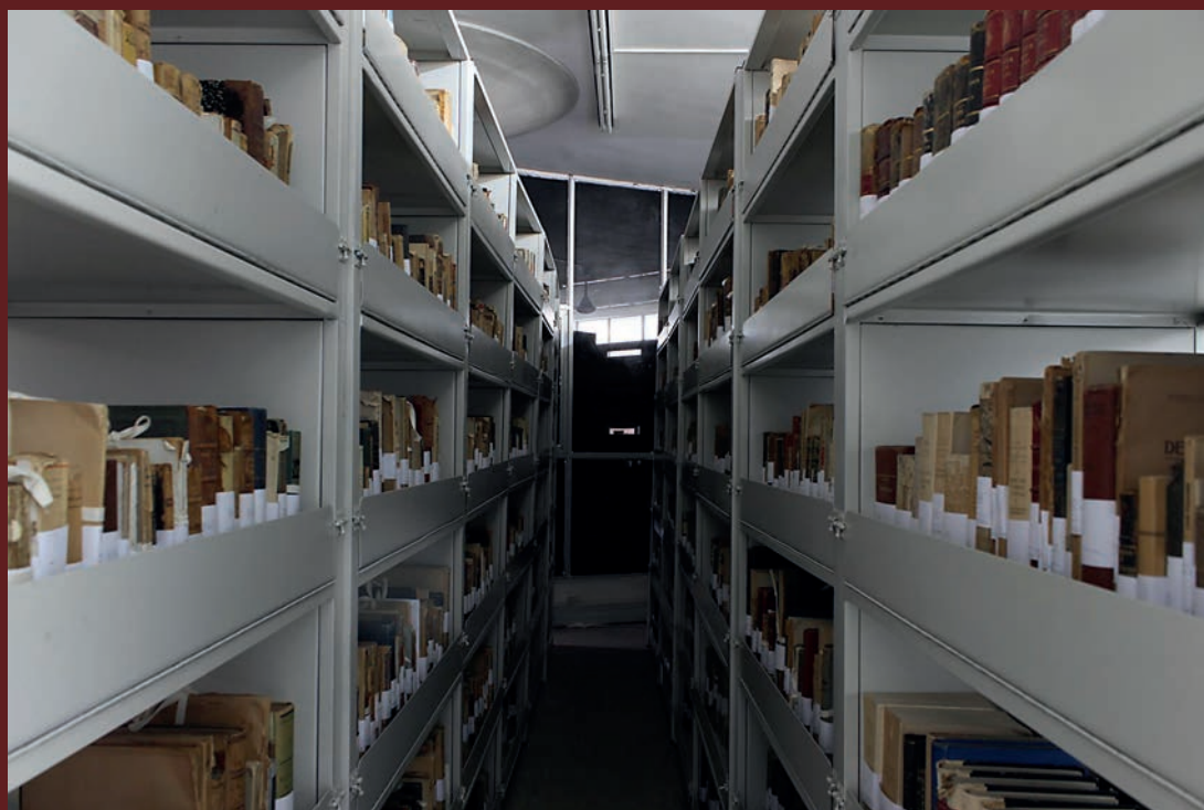
Estantería con las colecciones de la institución.

A día de hoy se cuenta con tres salas amplias y varios box de investigación, una sala de consulta habilitada con Soportes de lectura, un área de conservación, un área de digitalización, un depósito archivístico y un depósito bibliográfico.