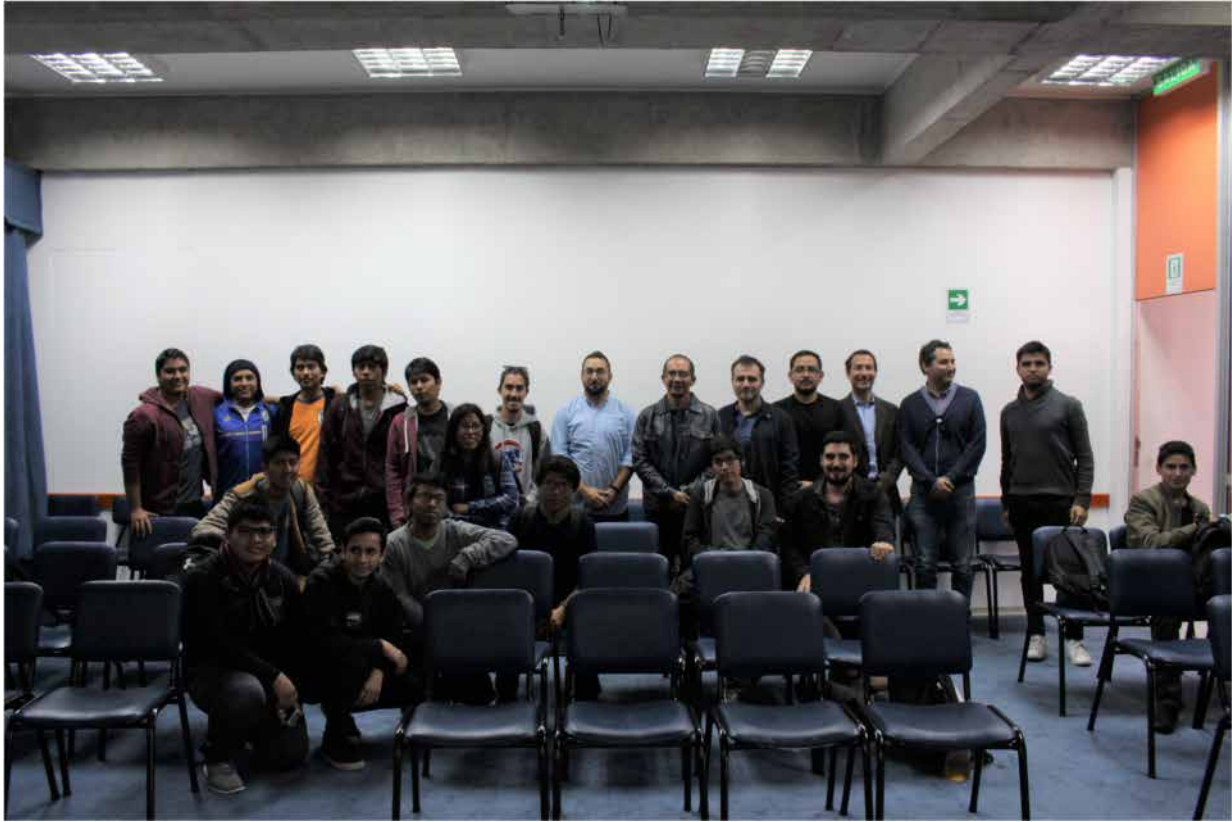
Figura 6 . Fotografía charla