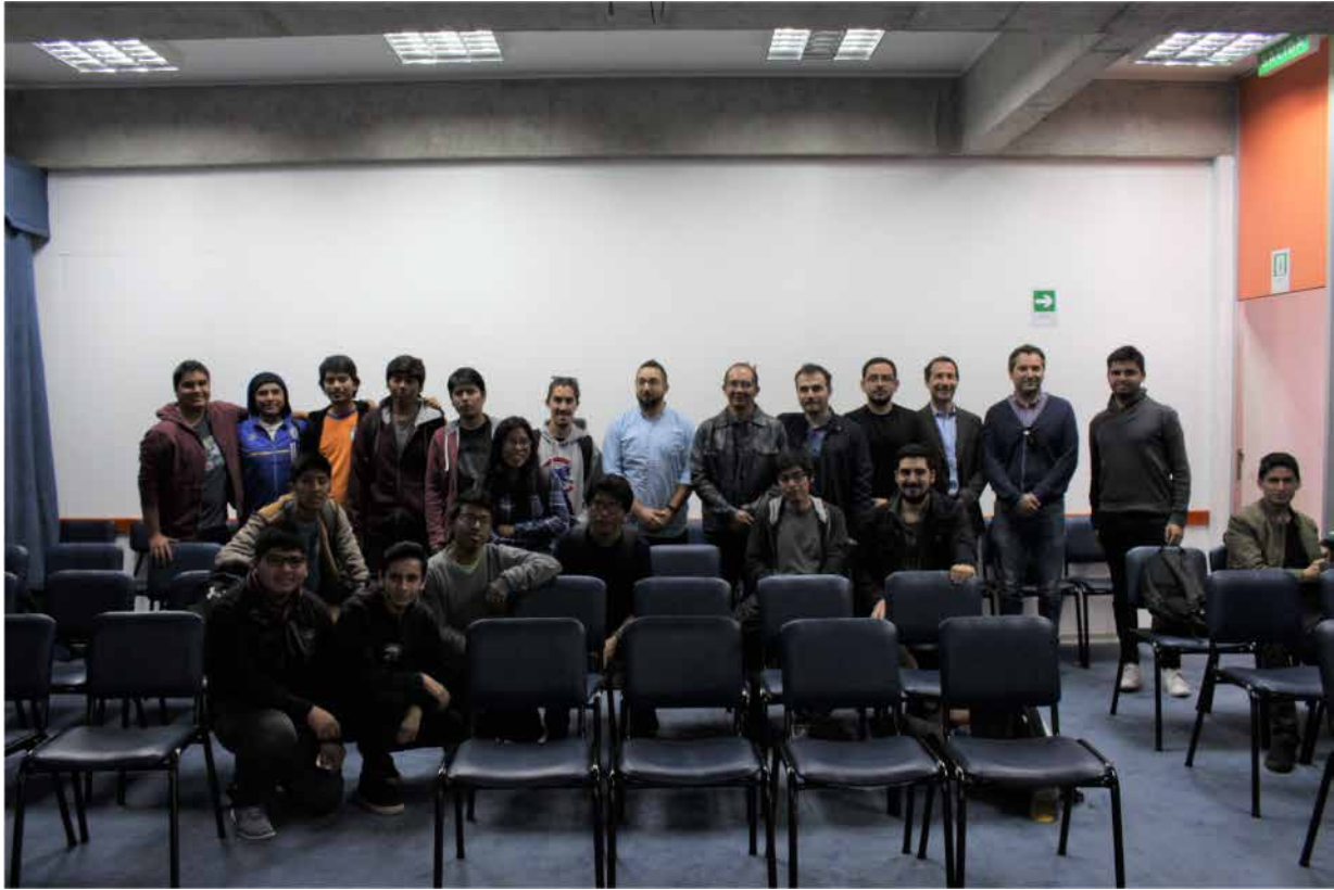
Figura 8 . Fotografía charla