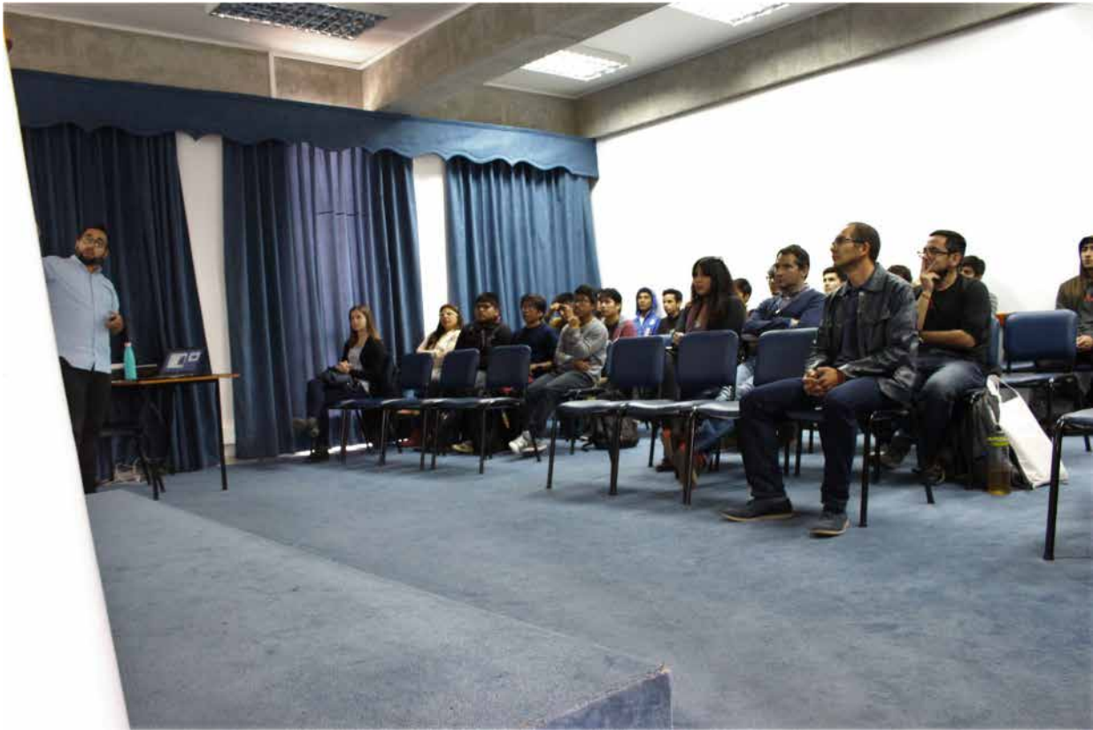
Figura 4 . Fotografía charla