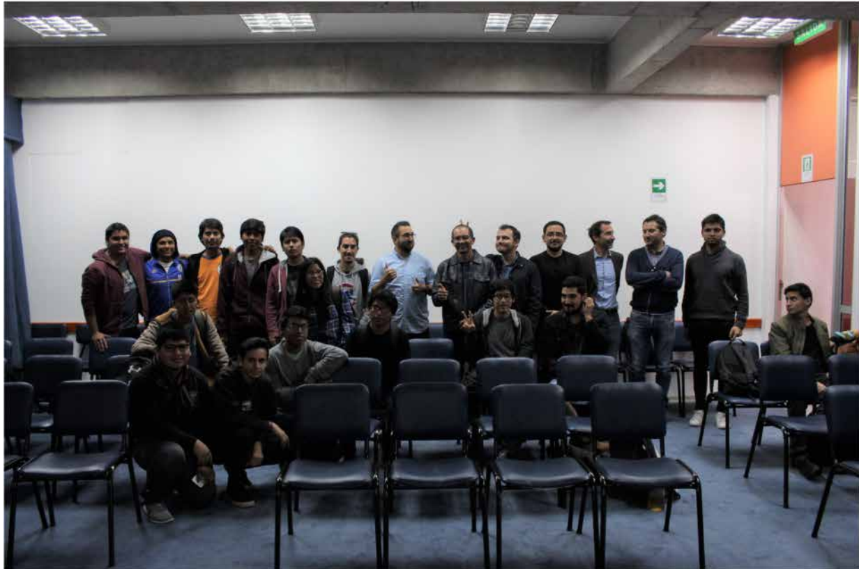
Figura 5 . Fotografía charla