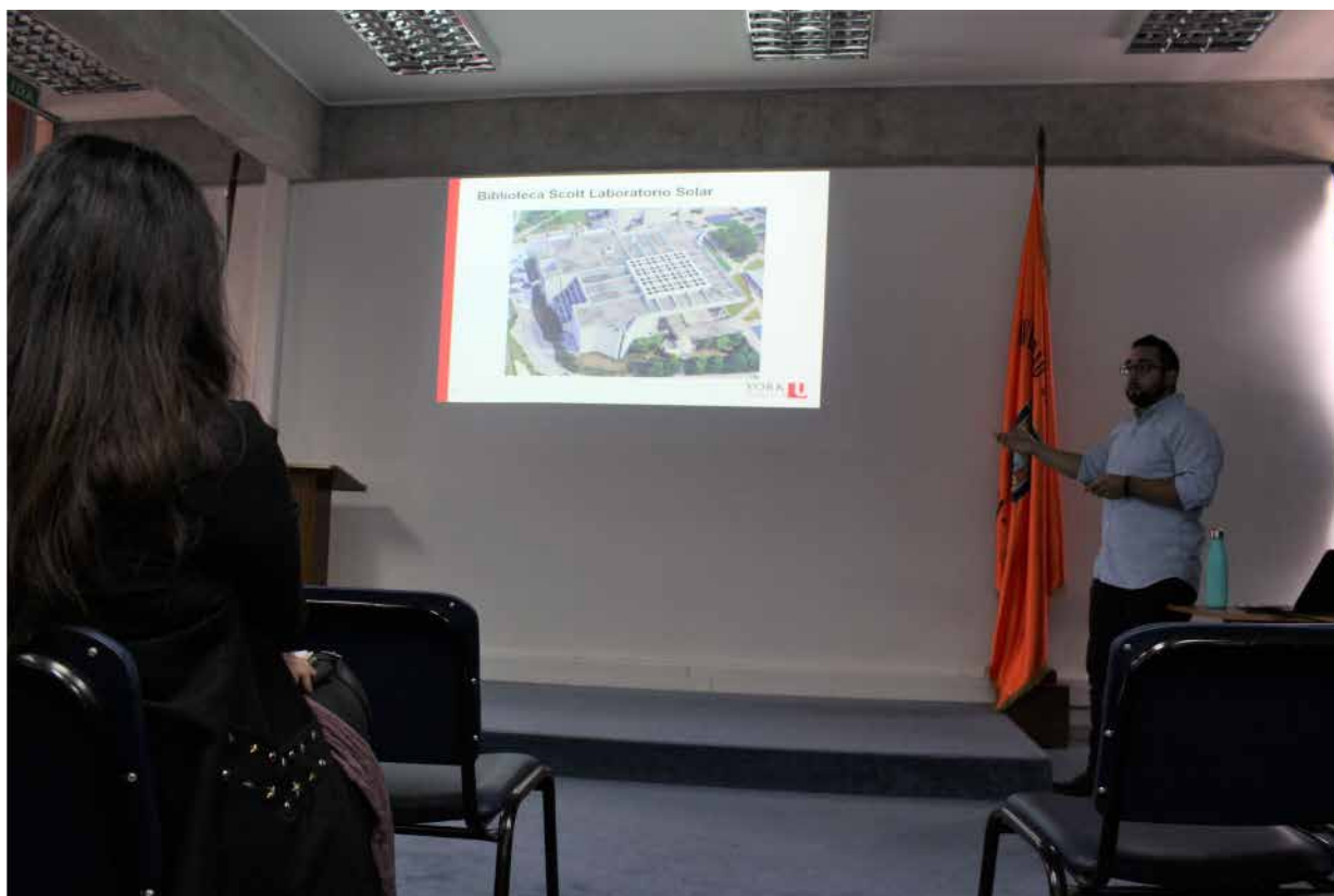
Figura 3 . Fotografía charla