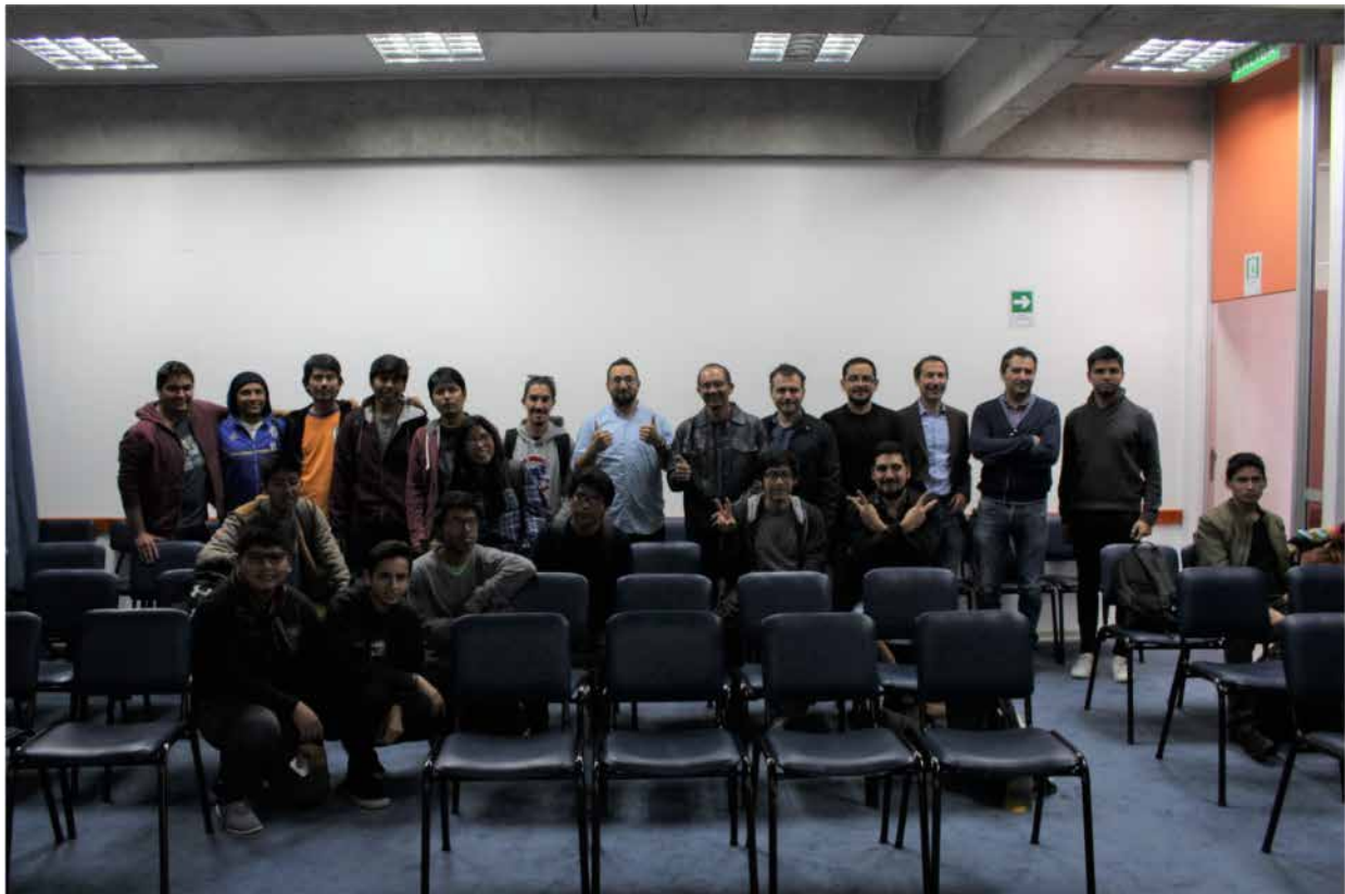
Figura 7 . Fotografía charla