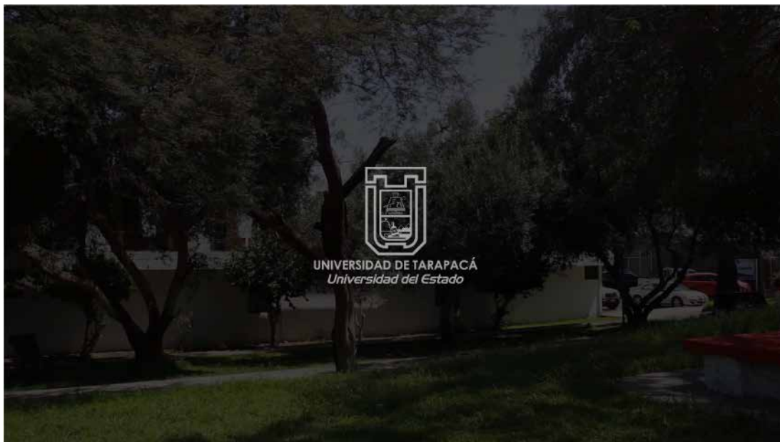
Figura 12. Inicio del video, mensaje para todo el departamento.