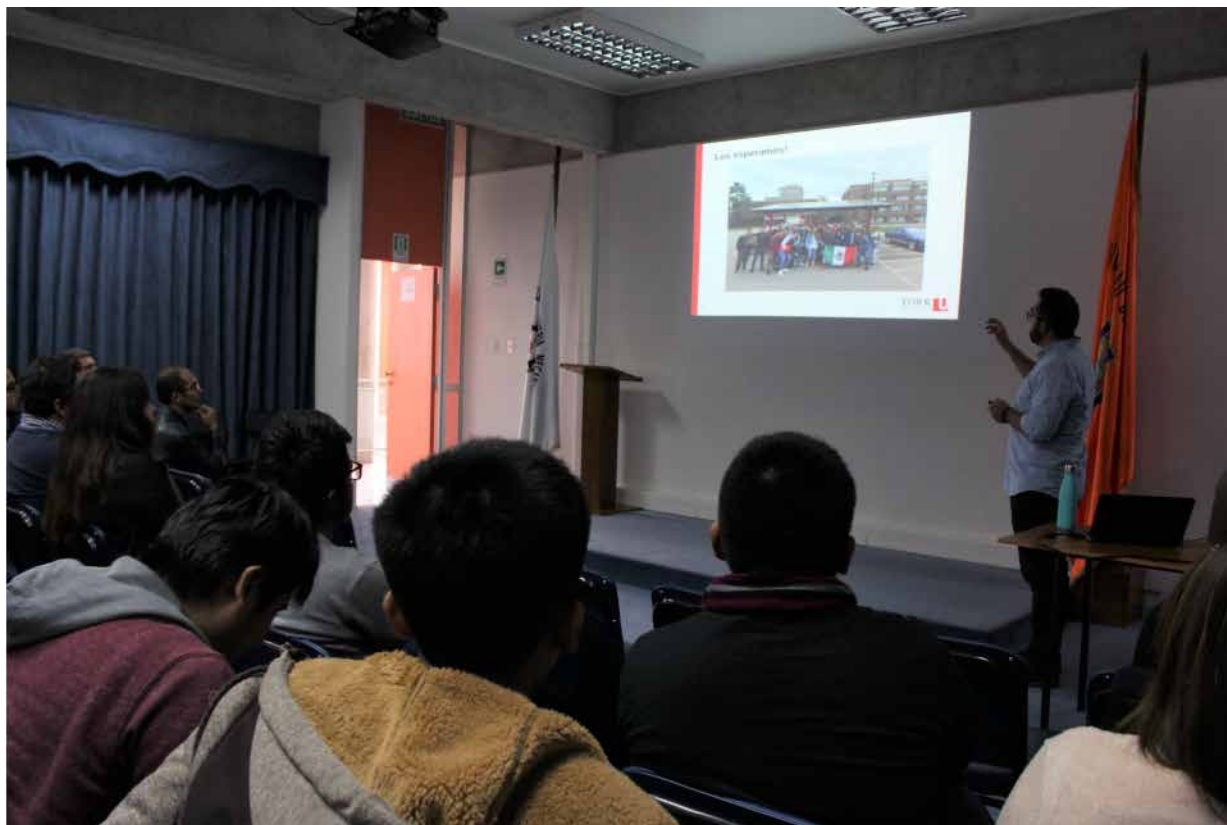
Figura 2 . Fotografía charla