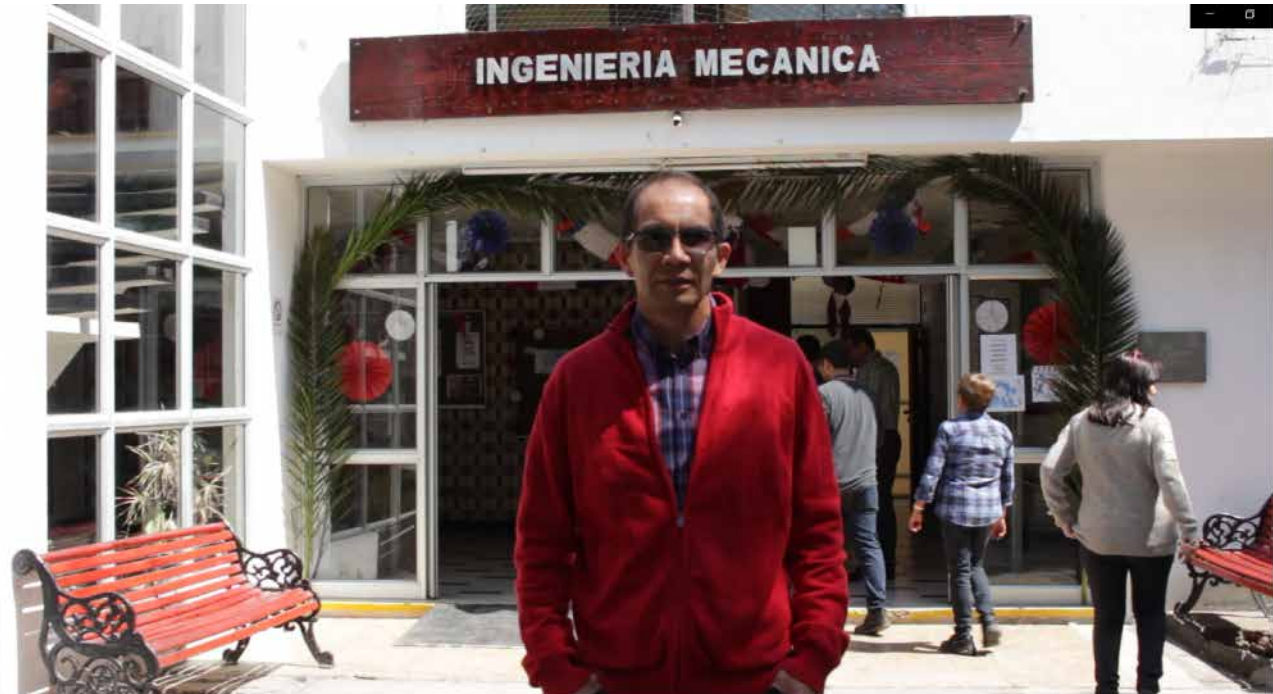
Figura 10 . Video invitación