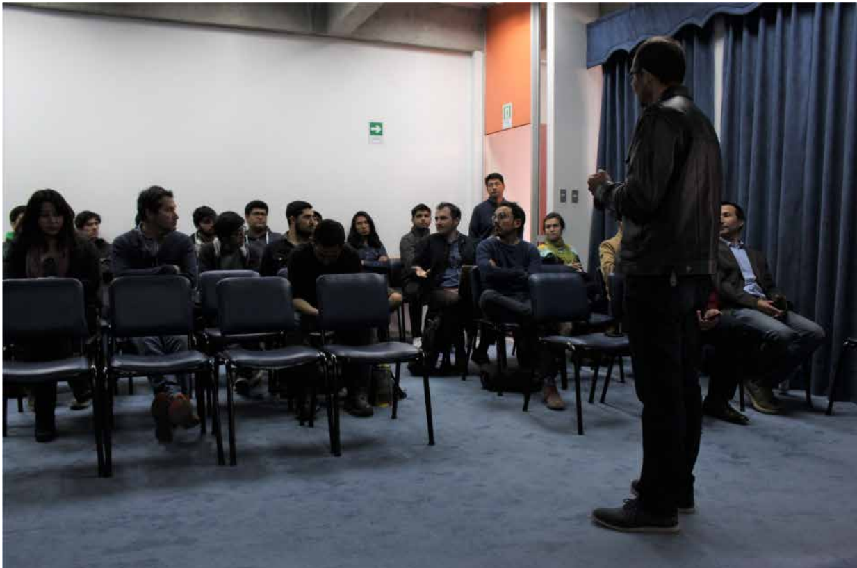
Figura 1 . Fotografía charla