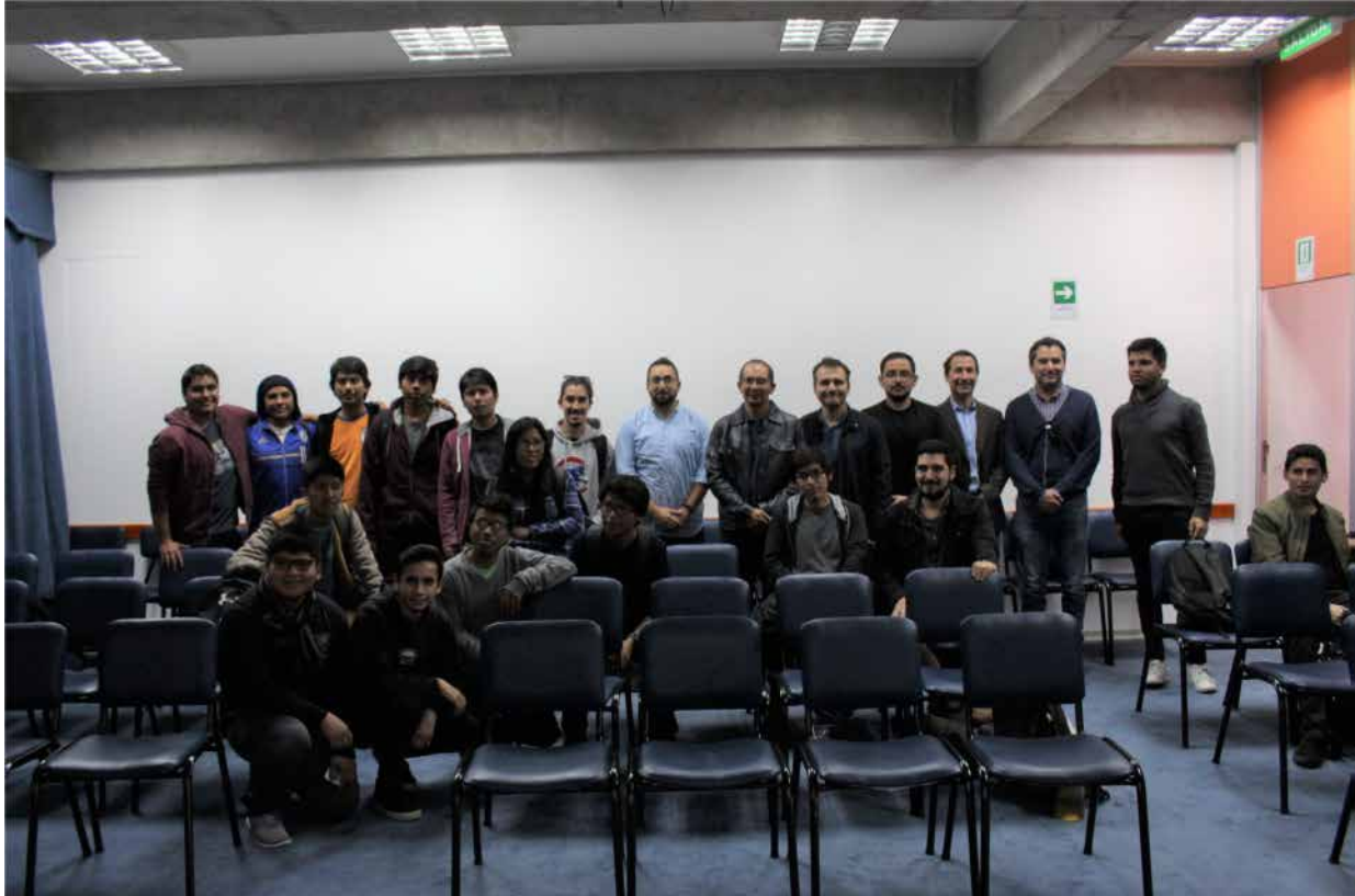
Figura 9 . Fotografía charla