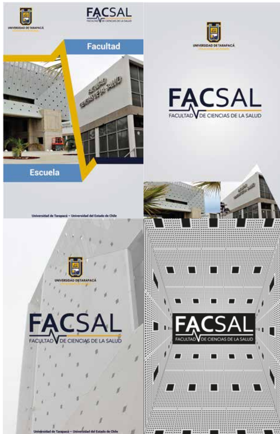
Fig.2 4 Propuestas de Portadas para Guía de investigación.

Por consiguiente, se realizaron fotografías a dos edificios de salud y medicina en la cual me proporcionaron una cámara semiprofesional Canon para las fotografías, después en sacar las fotografías y pasarlas al computador se realizó en 2 horas aprox. Y las 2 horas restantes se realizaron 4 propuestas de portadas.(Fig.2)