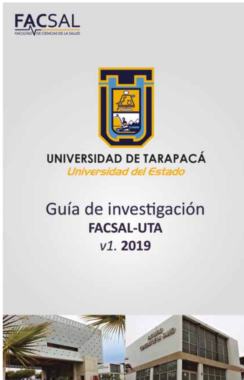
Fig.3 Portada final de Guía de investigación FACSAL-UTA 2019.

Después se realizó el traspaso de Word a PDF de la Guía de investigación FACSAL-UTA 2019 (Fig.3) utilizando el programa adobe Indesign la cual se completó en las horas autónomas por su minucioso desarrollo y revisión de los pequeños detalles de ortografía y demás. Finalmente, al acabar los trabajos asignados anteriormente se me propuso enseñar el uso de Wordpress con su respectivo formateo Word a HTML de la revista científica JOHAMCS, en la cual se dedicó 5 secciones de trabajo de 4 horas cada una aprox.